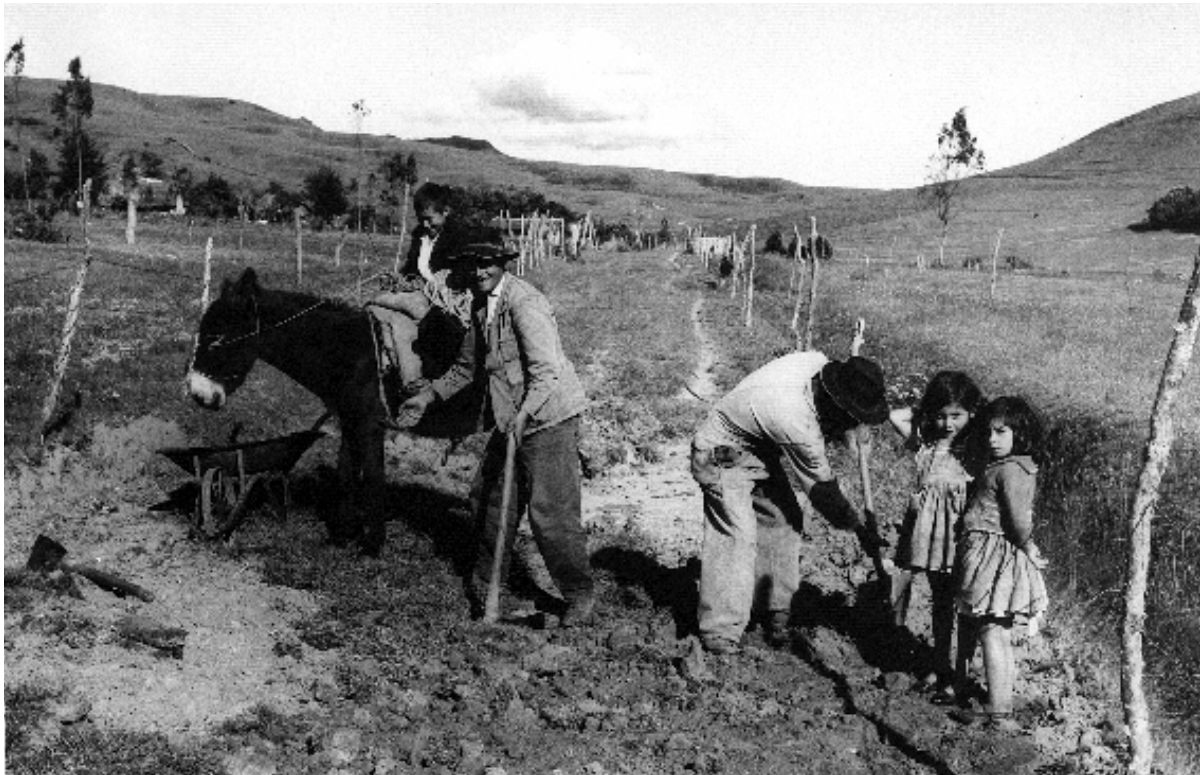
Fondo Orlando Fals Borda. Fotos 1950-1964. Archivo Central e Histórico Universidad Nacional de Colombia.