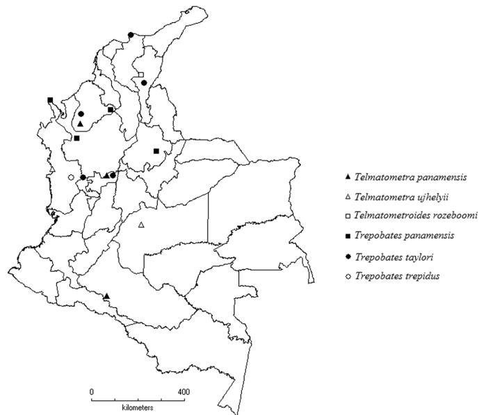
Figura 1. Nuevos registros de distribución geográfica para la subfamilia Trepobatinae (Gerridae) en Colombia.

Comentarios. Esta especie había sido registrada para Antioquia, Boyacá, Caldas, Caquetá, Casanare, Cauca, Cesar, Córdoba, Cundinamarca, Huila, La Guajira, Magdalena, Meta, Norte de Santander, Putumayo, Quindío, Risaralda, Santander, Sucre, Tolima y Valle del Cauca.