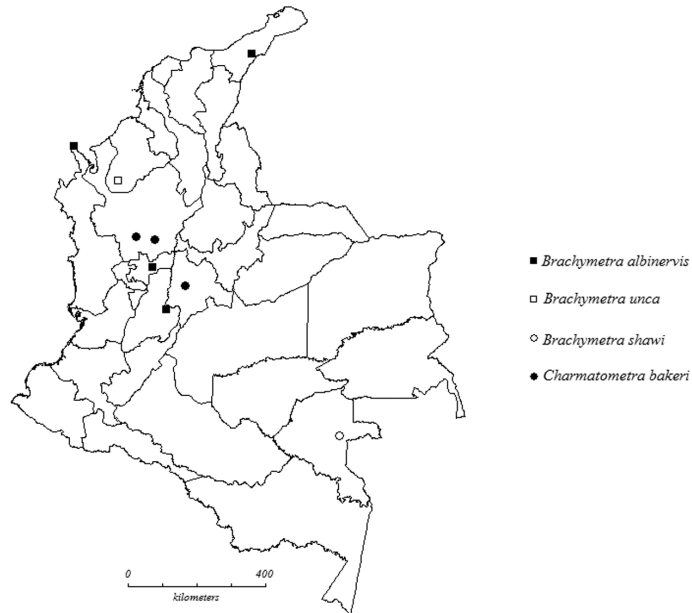
Fig. 4. Nuevos registros de distribución geográfica para la subfamilia Charmatometrinae (Gerridae) y primer registro de Brachymetra shawi para Colombia.

Comentarios. Esta especie había sido registrada para Boyacá, Caquetá, Huila, Meta, Nariño, Santander y Valle del Cauca.