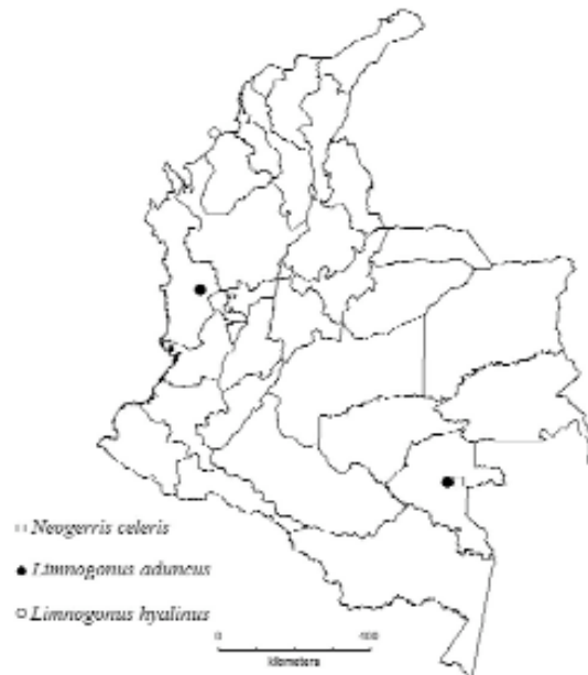
Figura 2. Nuevos registros de distribución geográfica para la subfamilia Gerrinae (Gerridae) y primer registro de Neogerris celeris para Colombia.

Comentarios. Registrada para el Brasil, Bolivia, Guyana y Paraguay (Drake y Harris, 1934; Kuitert 1942; Nieser 1970; Sampaio y Py-Daniel, 1993). Esta especie se reconoce por tener el pronoto prolongado posteriormente cubriendo el mesonoto, color negro y es de mayor tamaño que N. lubricus . En el macho el octavo segmento abdominal con una depresión media, hembra con conexivas redondeadas en el ápice (Drake y Harris, 1934).