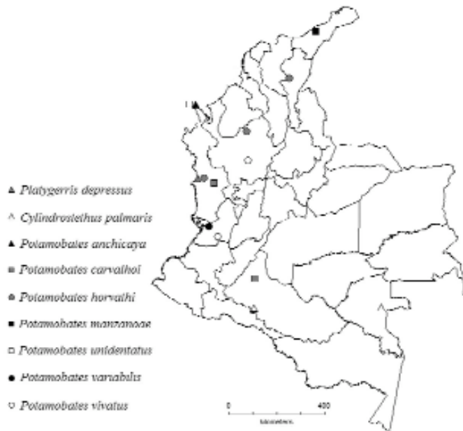
Figura 3. Nuevos registros de distribución geográfica para la subfamilia Cylindrostethinae (Gerridae) y primer registro de Potamobates variabilis para Colombia.

Comentarios. Esta especie había sido registrada para el Caquetá, Casanare, Cundinamarca y Meta.