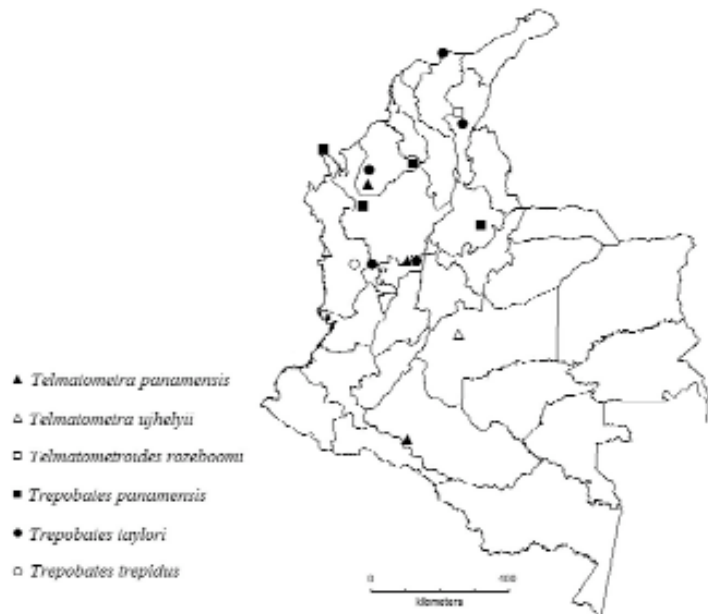
Figura 1. Nuevos registros de distribución geográfica para la subfamilia Trepobatinae (Gerridae) en Colombia.

Comentarios. Esta especie había sido registrada para Antioquia, Boyacá, Caldas, Caquetá, Casanare, Cauca, Cesar, Córdoba, Cundinamarca, Huila, La Guajira, Magdalena, Meta, Norte de Santander, Putumayo, Quindío, Risaralda, Santander, Sucre, Tolima y Valle del Cauca.