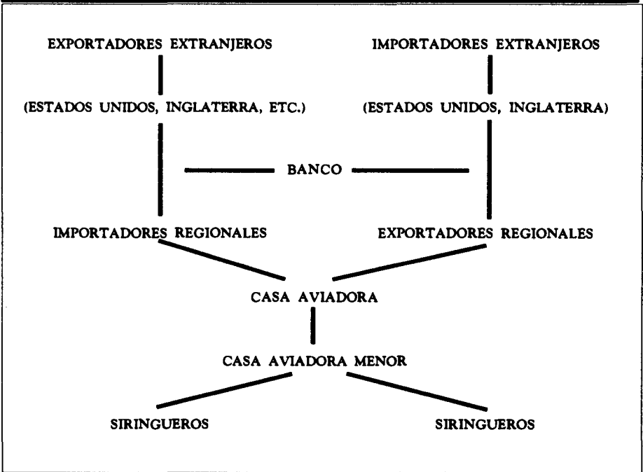
CUADRO No. 6 ORGANIZACIÓN INDUSTRIAL DEL CAUCHO INGLATERRA, E.U.A.

Si bien la tecnología de extracción fue "primitiva" o rudimentaria, la estructura de comercialización alcanzó un nivel de complejidad considerable. De acuerdo con Santos, tenían este tipo de estructura: