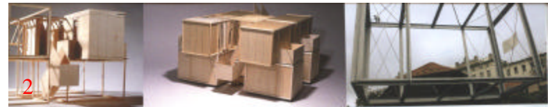
1.  2.