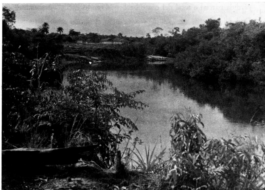
2. Asentamiento ribereño a orillas del Caño Bocón.