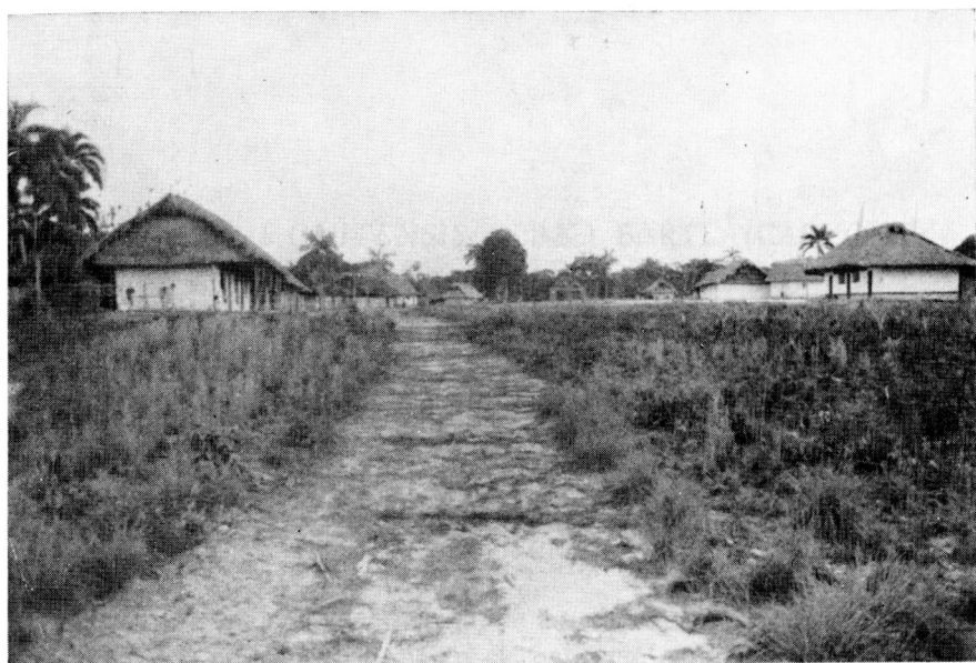
3. Tipo de aldea y vivienda introducida por comerciantes y misioneros.