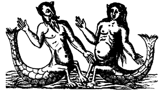
• Tritón y Sirena.

Con excepción del tópico de la Pasión, que tenía un significado especial en la piedad neogranadina, las representaciones de Jesús adulto se llevaron a cabo bajo elementos icónicos similares, y aunque variaba la inventio , el modelo del “maestro” fue el mismo. Situación similar ocurrió con la representación de la Virgen que, independientemente su advocación, mantuvo prácticamente los mismos rasgos. En este sentido, no se trata solamente de la belleza del rostro, sino también de la proporción, color y simetría, es decir, se trata de la espacialidad del cuerpo.