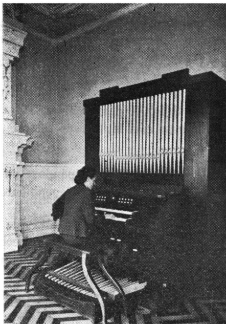
CONSERVATORIO NACIONAL DE MÚSICA Estudio de órgano.