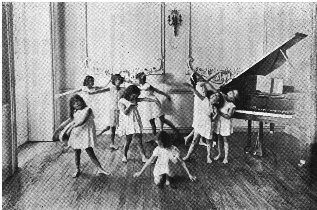
CONSERVATORIO NACIONAL DE MUSICA. Clase de Gimnasia Rítmica.