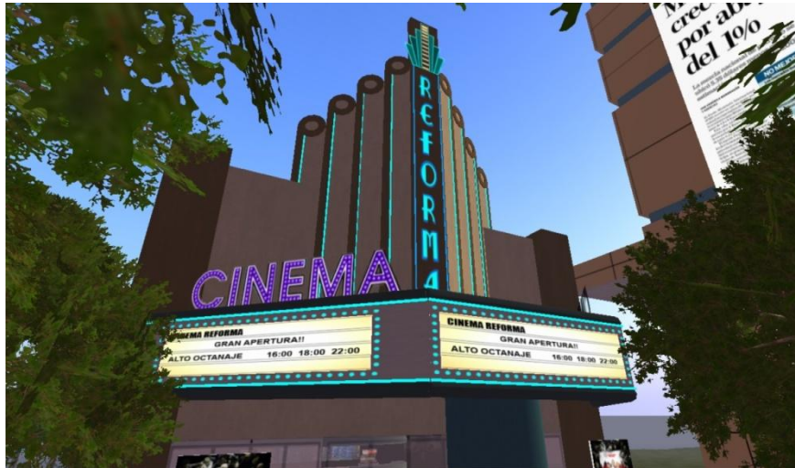
Figura N.3 Calles de Reforma sim

La calle virtual donde llegan más residentes está sobre la entrada de la tienda de ropa y objetos, en la esquina de está, se encuentra Matatena, con sus anuncios de sus djs exclusivos.