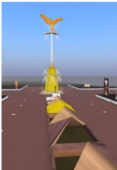
Figura N. 1 Reforma Sim

Las personas que hablan español suelen empezar su travesía en el Second Life, en islas donde los residentes hablen su mismo idioma iv . Para los hispanoparlantes mexicanos las islas más recurrentes son: Chichén Itzá, Monterrey, Tequila, Jalisco y Reforma, esta última es una de las que cuenta con un mayor número de participantes, por tal motivo fue el espacio donde se realizó la etnografía.