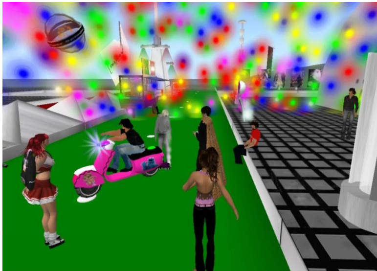
Figura N.4 Matatena disco virtual de Reforma

La calle virtual donde llegan más residentes está sobre la entrada de la tienda de ropa y objetos, en la esquina de está, se encuentra Matatena, con sus anuncios de sus djs exclusivos.