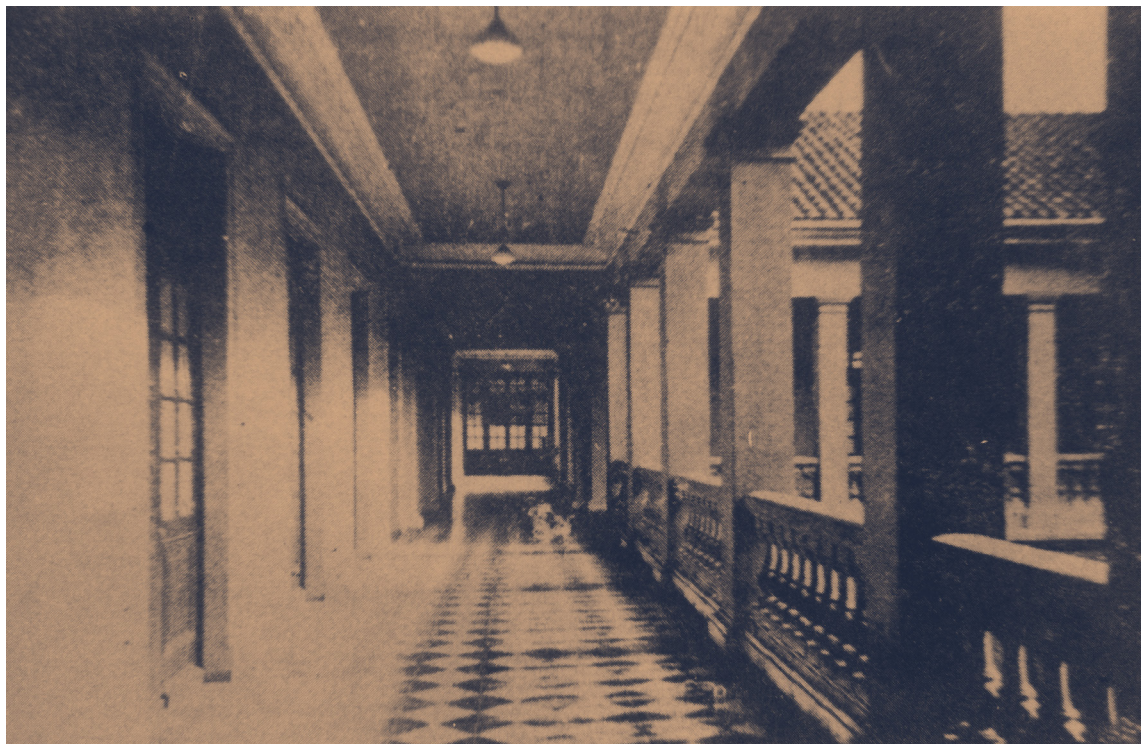
Costado oriental del claustro de la Escuela Nacional de Odontología