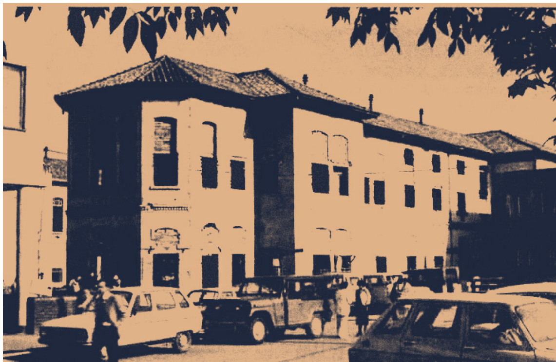
Costado sur oriental de la Facultad de Medicina