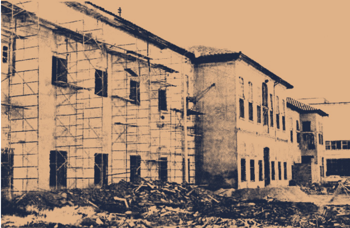
Fachada principal de la Facultad de Medicina, costado occidental