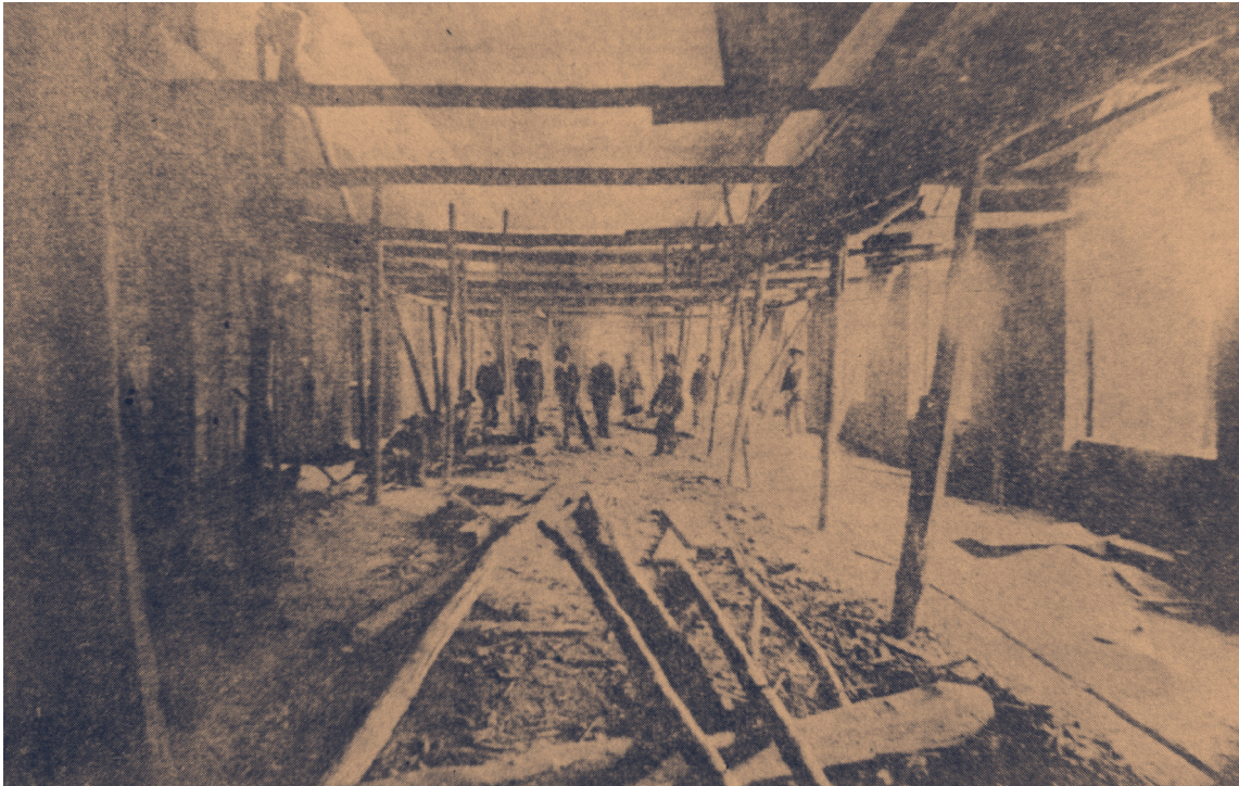
Gran salón de las clínicas, que estaba por terminarse