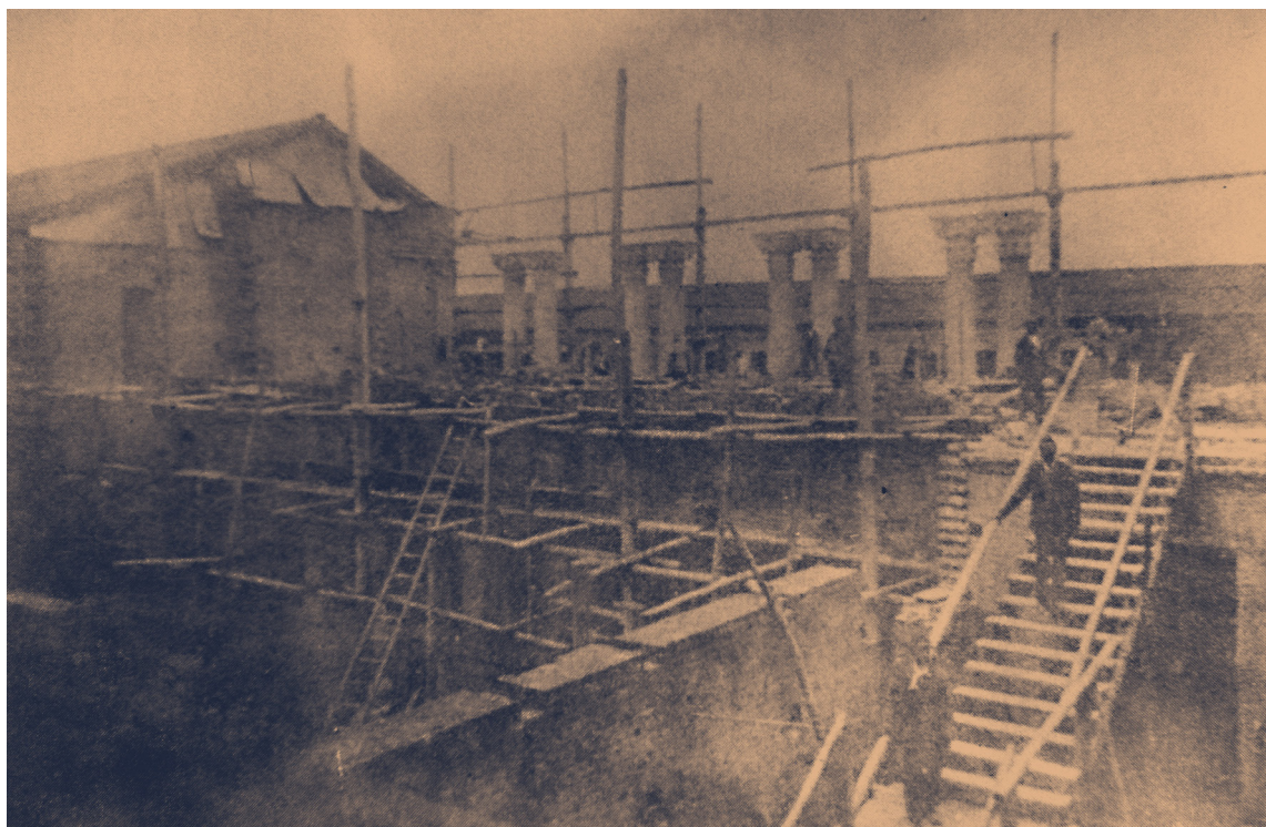
Escuela de Odontología, Calle 10, Carrera 10ª, costado sur en construcción