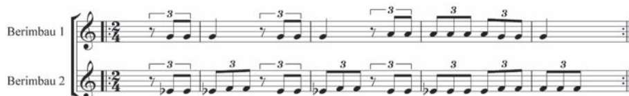
Figura 2: Transcripción de dos berimbaus en roda de Mestre Waldemar. En la grafía original las líneas melódicas de ambos berimbaus se encontraban superpuestas en un solo pentagrama. Por claridad, el autor las ha separado y ha incluido los textos berimbau 1 y berimbau 2, así como el indicador de métrica de compás 2/4.

De esta cita puede deducirse lo que Catunda encuentra realmente importante en el berimbau, lo cual lo convierte en un instrumento “definitivamente musical”. Se trata de la altura de los sonidos y de la relación interválica que entre ellos se forma, al combinarlos. En otras palabras, de la capacidad que tienen para crear una base armónica, entendida al modo de la música occidental.