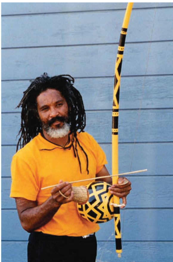
▲ Mestre Cobra Mansa mostrando la forma de agarre del berimbau en Capoeira.

(la afinación del berimbau escapa a la rigidez de la afinación temperada de la música occidental). Este sonido es conocido como preso . Un tercer sonido se logra al rozar el arame suavemente con el dobrão y percutirlo con la baqueta. Este sonido tiene igual afinación al preso , pero contiene un zumbido del alambre que, al vibrar contra el dobrão , le vale el nombre de chiado .