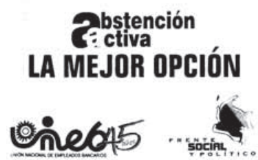
7. Folleto difundido por la Unión Nacional de empleados bancarios (Uneb) y por el Frente Social y Político (FSP). La labor pedagógica es efectuada por completo de forma escrita. Cabe destacar la sencillez del lenguaje empleado y el uso de términos coloquiales.