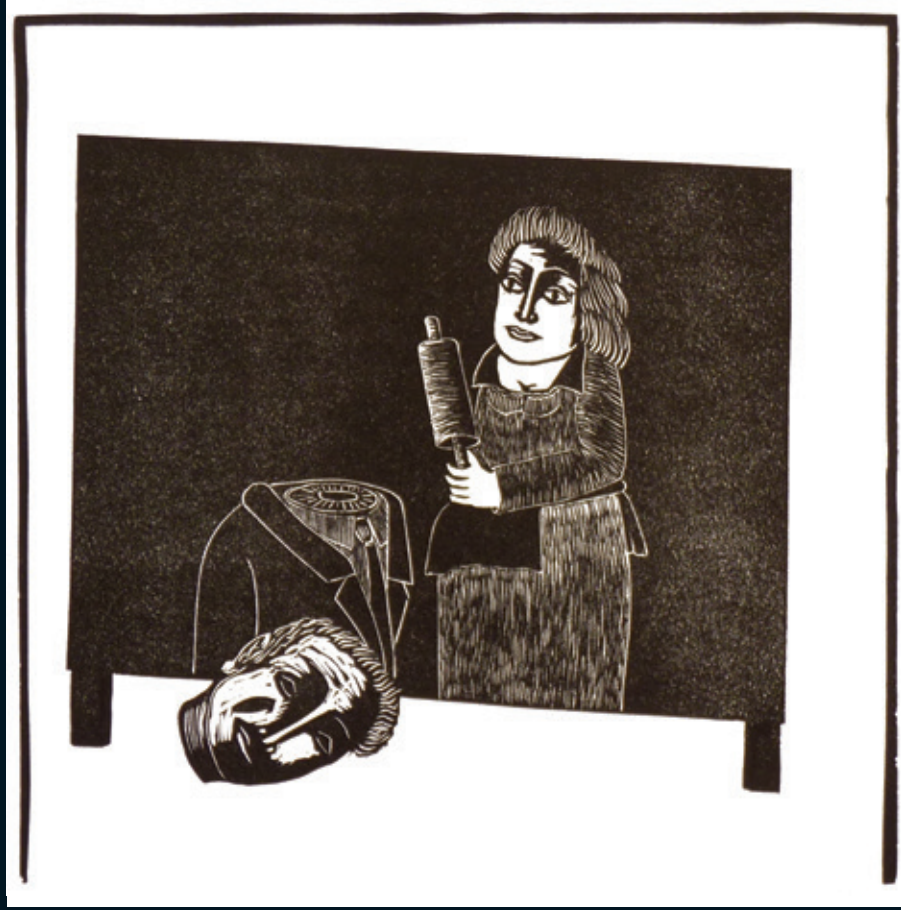
© Antonio Samudio. Violencia moderada . Linóleo, 2006. 34x34 cm.