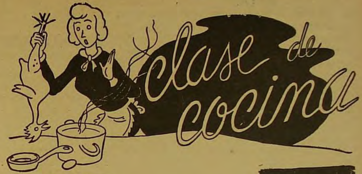
Por Cecilia López R. ESPINACAS

El agua de hiedra hervida sirve para lavar prendas negras de lana y de algodón.