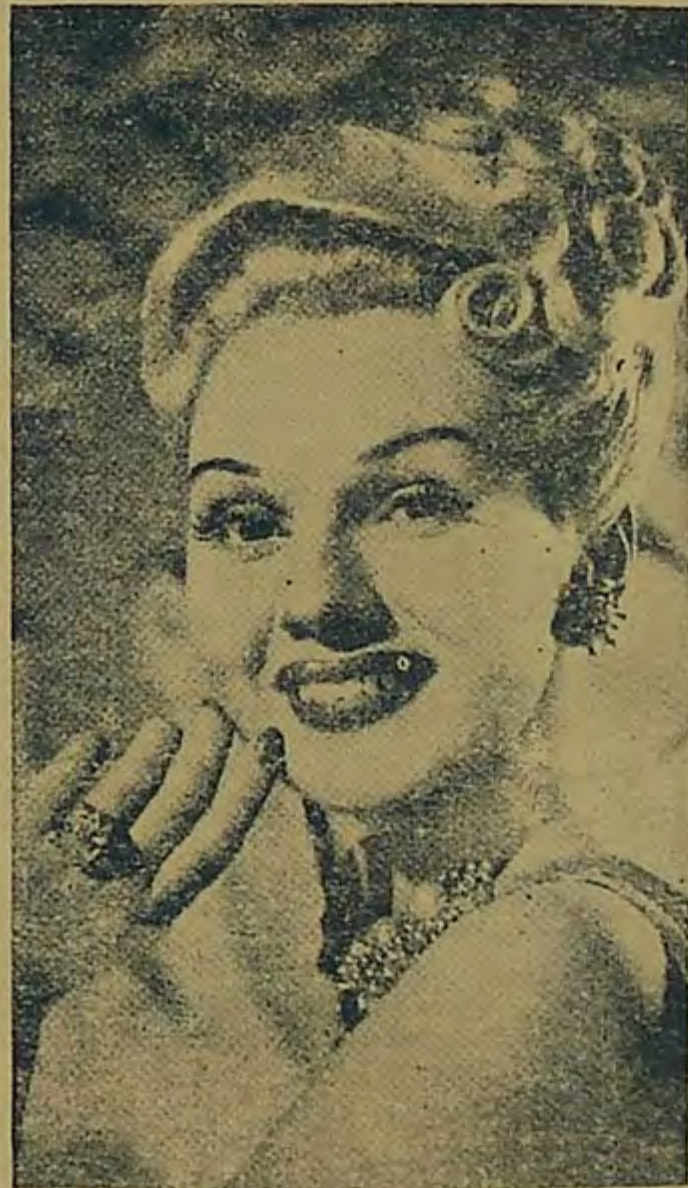
ADELE JERGENS, Estrella de Columbia