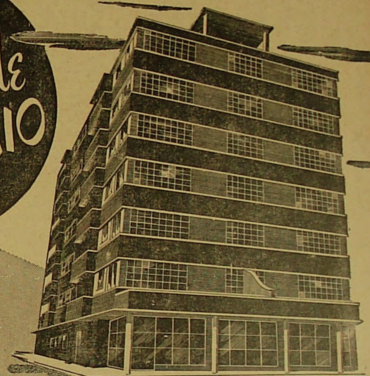
Edificio "RUTOCO" Medellin

Los EQUIPOS METALICOS DE COCINA utilizados en la dotación de los moder- nos apartamentos del Edificio "RUTOCO" de Medellín, fueron sumi- nistrados por ELOSPINA.