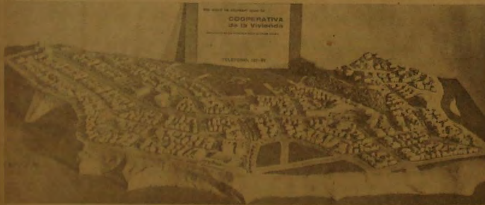
La ciudad Cooperativa de San Javier en miniatura... así puede apreciarse en la vista panorámica de la maqueta que ha llamado tanto la atención del público.

Un documento trascendental.- El Papa Pío XII y Roosevelt son los que mejor han hablado con un profundo sentido humano y con un anhelo infinito de dar al mundo un nuevo orden cristiano. El Papa ha hablado otra vez, y lo ha hecho con un fervor heroico. Los términos de su última alocución, por lo precisos, exactos, severos y enérgicos, revelan una larga meditación dentro de la mayor serenidad.