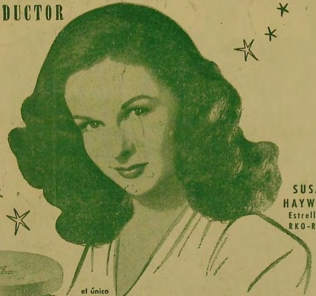
SUSAN HAYWARD Estrella de RKO-Radio

Añada nuevo encanto a su tez. ahora mismo . . . en sólo unos segundos . . . con Maquillaje Pan-Cake, el famoso maquillaje glamorizador de las estrellas, originado por Max Factor Hollywood . Le encantará el nuevo cutis que le da, suave, precioso, sin una falta . . . y le sorprenderá cómo ayuda a ocultar pequeños defectos de la piel. Pruebe el Maquillaje Pan-Cake una vez y comprenderá por qué las estrellas de la pantalla dicen que es el mejor maquillaje de glamor en la historia de los cosméticos.