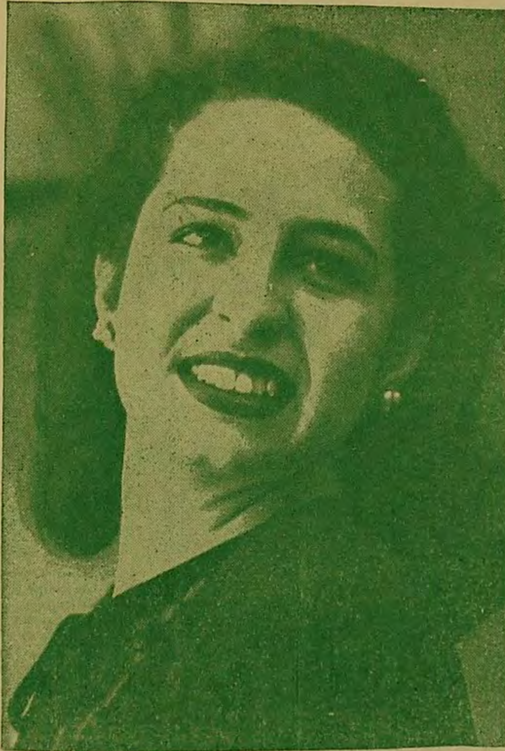
S. M. CONSUELO 1ª.

AÑO XXIII - No. 265 M E D E L L I N AGOSTO DE 1948