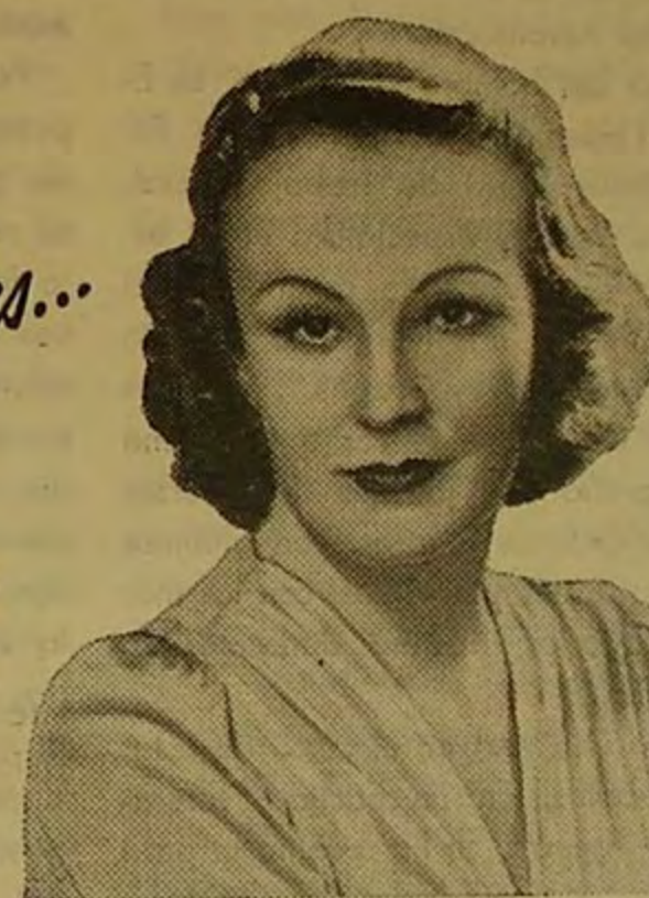
LA DUQUESA DE BRONTE, bella dama de la sociedad Inglesa, dice: "Los Polvos Pond's parecen impartir a mi tez un tono más suave y sutil."

● ¡Ahora los Polvos Pond's Flor de Ensueños imparten a su cutis más seductora dulzura! Por lo diáfanos y por lo bien que se adhieren, estos polvos dan a su rostro más claridad, suavidad y delicadeza... por horas y horas. Elija su matiz de Polvos Pond's hoy mismo.