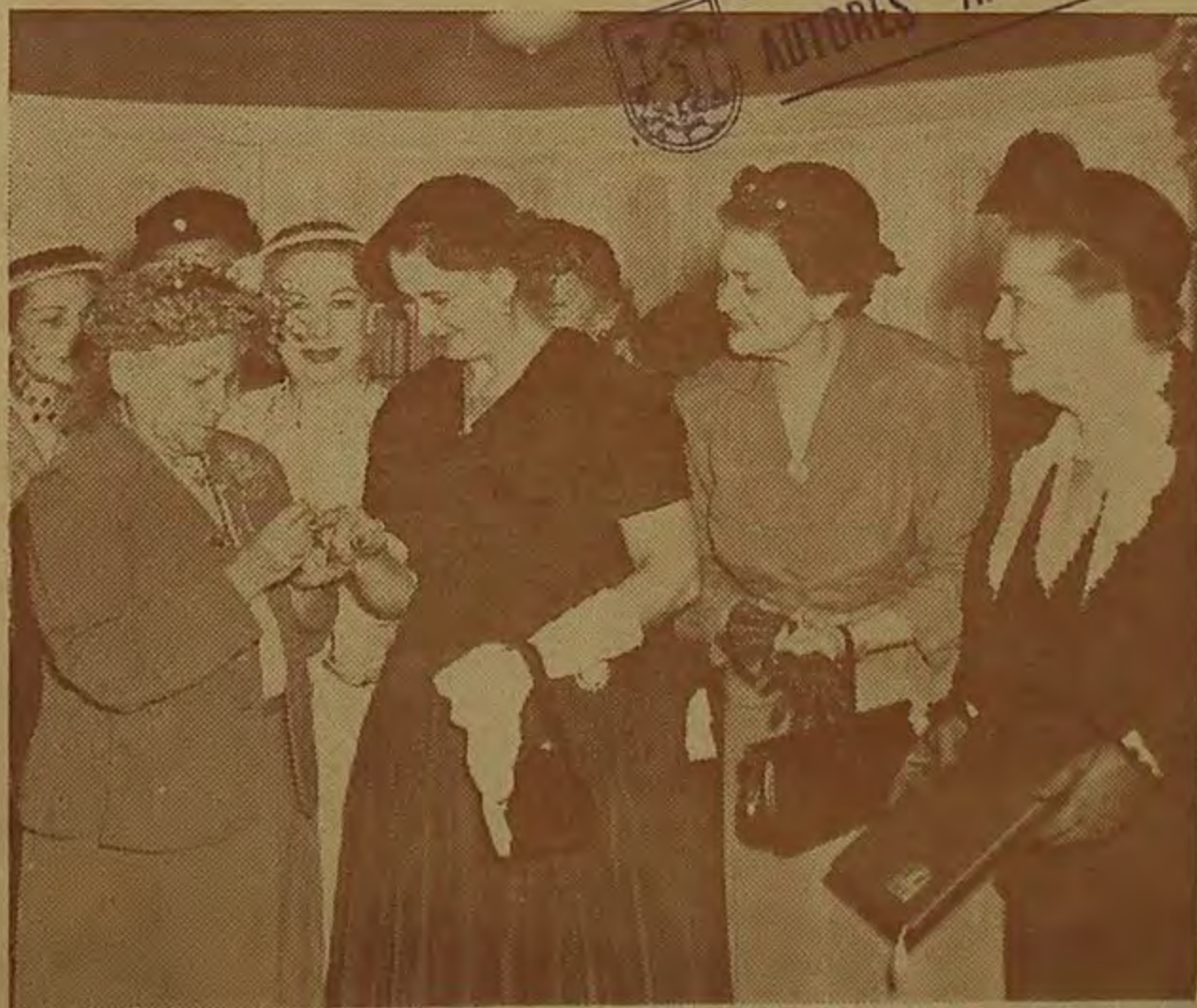
ENTREGA DEL ANILLO DE ESMERALDAS A LA PRIMERA DAMA DE LA REPUBLICA -VEASE PAGINA 3199-