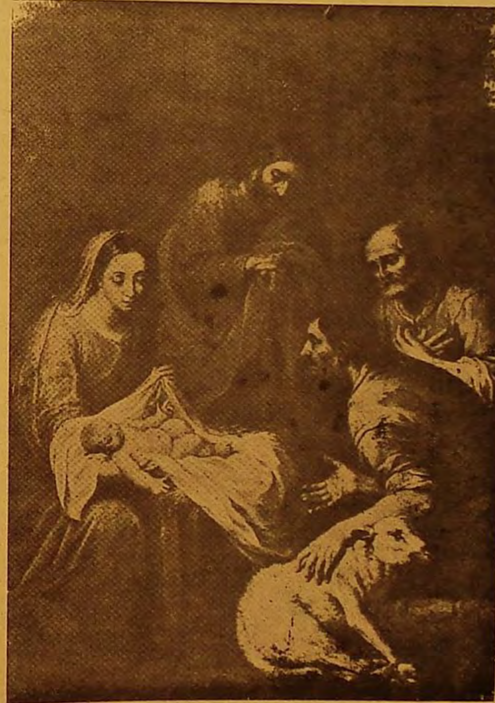
NACIMIENTO DE JESUS