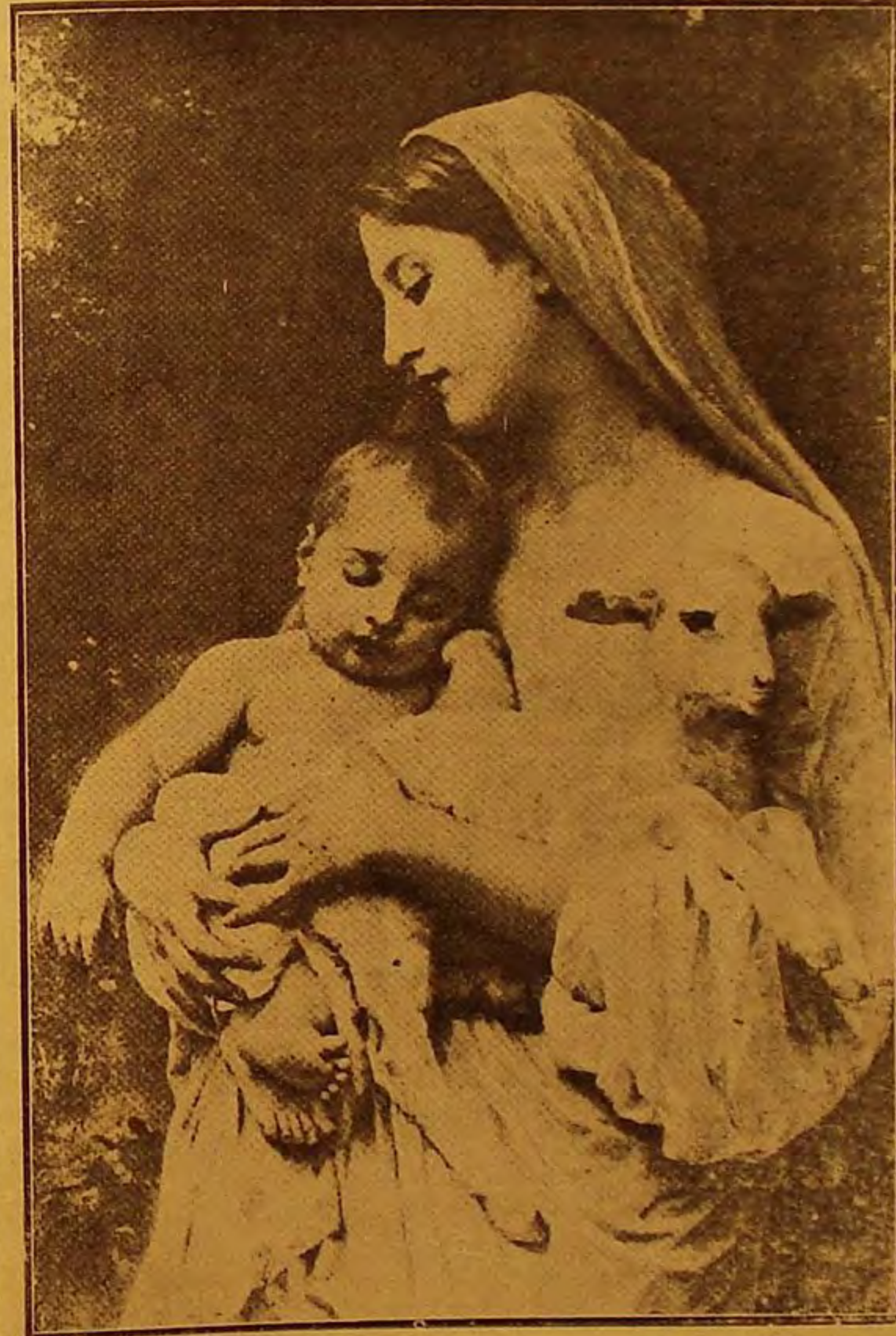
LA VIRGEN MARIA Y SU DIVINO HIJO JESUS.