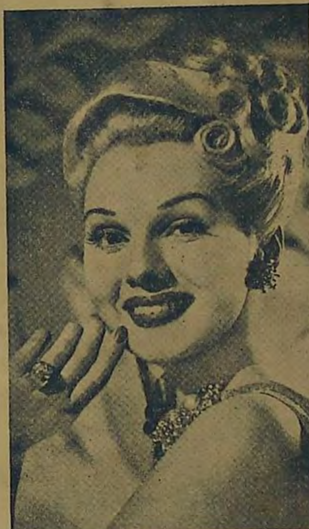
ADELE JERGENS, Estrella de Columbia

EN MENOS DE UN MINUTO... Maquillaje Pan-Cake le da una nueva tez, natural, sin el menor defecto, preciosa, nunca lustrosa ni de aspecto artificial.