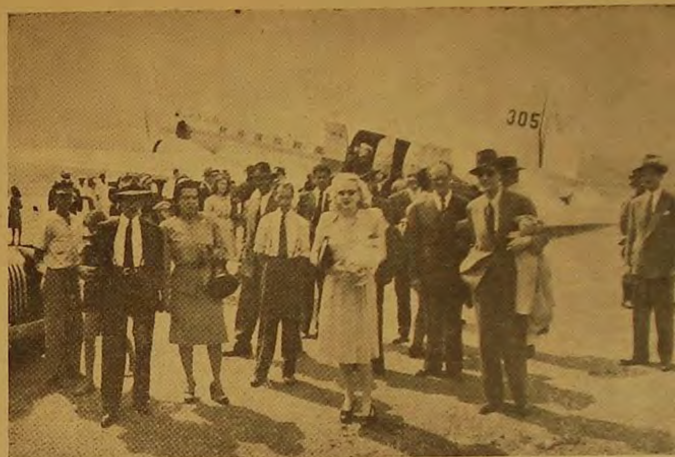
Llegada de la "Cía. Paulina Singerman" al aeropuerto de "Las Playas"

—Es algo que no se puede evitar, nos dijo, cuando tomamos el avión en Maracaibo, todos los de la Compañía mostraban una cara de angustia tal, que hubo que engañarlos diciéndoles que el viaje era de cinco horas; naturalmente al llegar más pronto sentirían un cansancio enorme; yo misma no podía evitar estos nervios, pero a Dios