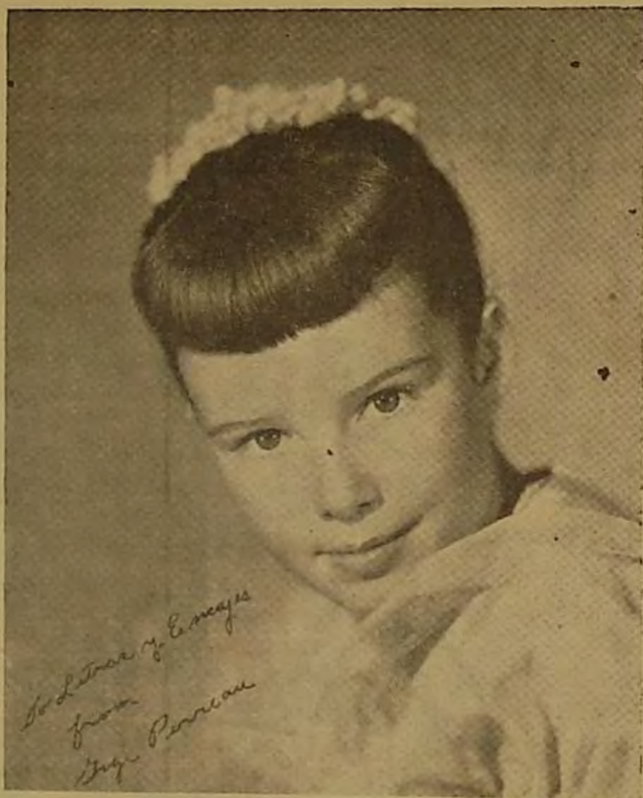
Gigi Perreau, la estrellita infantil de la Universal-International, que ha sabido distinguirse por su actuación maravillosa junto a grandes artistas de la pantalla. Su talento va a demostrarlo una vez más al lado de Linda Darnell en la deliciosa película "Quiero que me quieras".

Muy por encima del arte de algunos astros y estrellas del cine, de los que injustificadamente se hace una publicidad exagerada desde las páginas de millares de revistas del mundo entero, está el arte maravilloso de los niños, esos pequeños grandes artistas que se agigantan a través de sus actuaciones en la pantalla. Y, sin embargo, muy poco se habla de esos astros en miniatura, cuyos nombres ape-