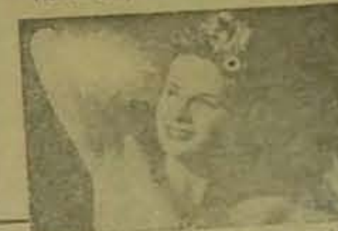
ARRID es una crema blanca, inocua, no irrita

SUPRIMEN LAS MANCHAS DESAGRADABLES EN LAS MANGAS