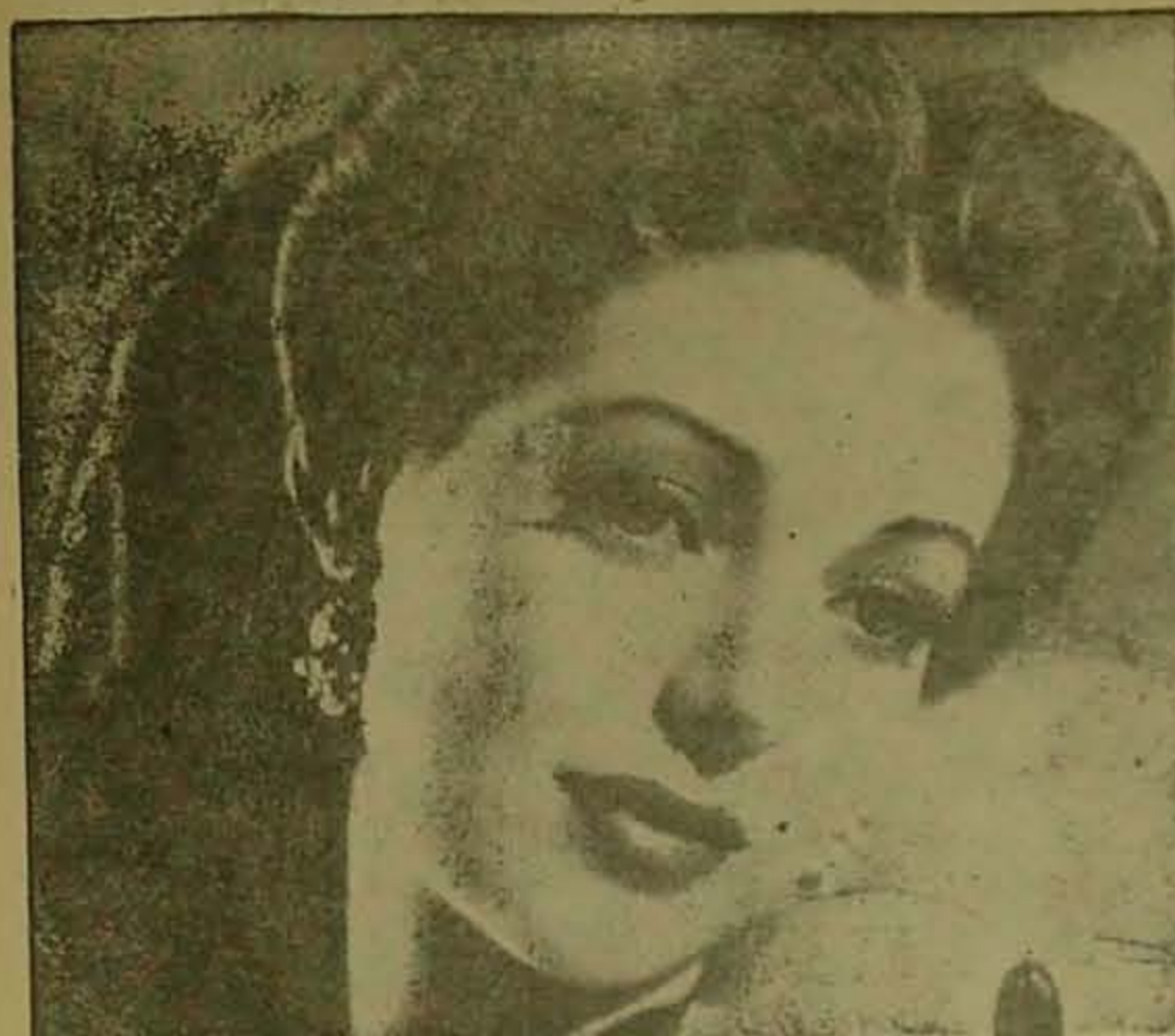
LORETTA YOUNG ESTRELLA DE COLUMBIA

Nos cuenta la leyenda azteca que Popocatepetl y su novia Ixtaccihuatl, llegaron a los portales del Valle de México en su viaje de luna de miel. Gigante como es, Popocatepetl se dio inmediata cuenta de que el valle, que tan sólo medía 64 kilómetros de latitud, era demasiado angosto para su tamaño. Rogó a su cara mitad que descansara mientras él trataba de encontrar otra vía más ancha que les permitiera proseguir. Tuvo poco éxito en su búsqueda y regresó al lado de su dulce compañera que bastante fatigada, había caído profundamente dormida. Avidamente reposó al lado de ella en espera de que despertara de su eterna siesta.