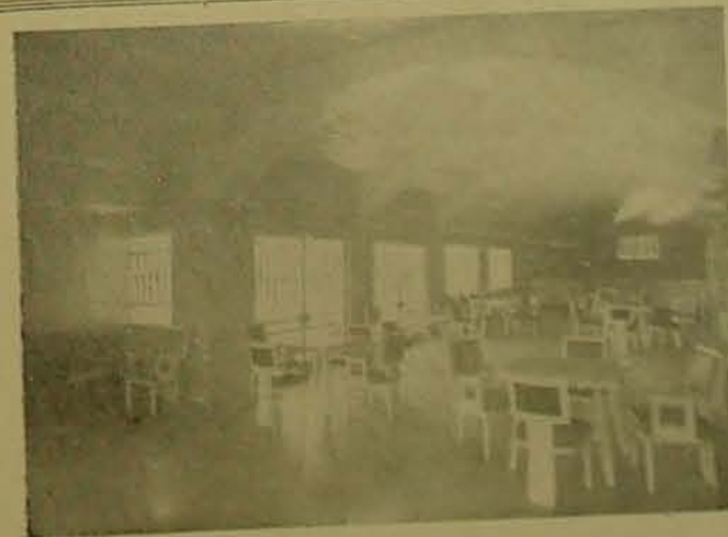
Lujoso Bar del San Fernando.

Las mejores programaciones hípicas y el halago de sus grandes dividendos hacen que su pista sea preferida.