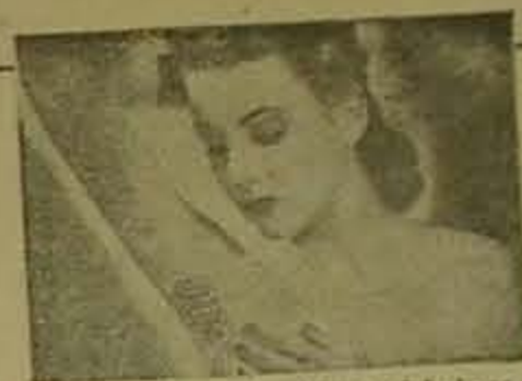
Piel irritada por desodorantes inferiores