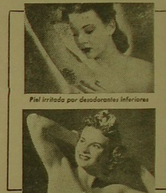
Piel irritada por desodorantes inferiores