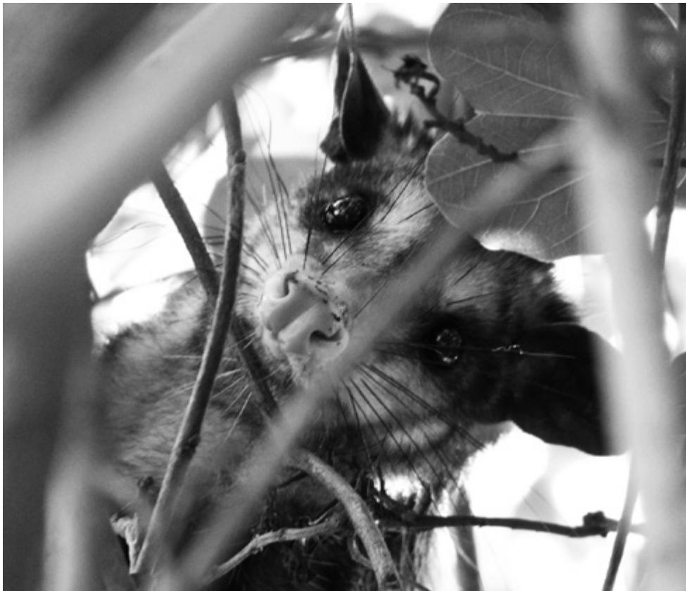
Zarigueya registrada en la zona.

del suelo; la relación de las raíces aéreas es muy elevada, toda vez que las raíces sobre un suelo siempre húmedo no necesitan profundizar. Y eso lo sabe el río que a veces se desborda para irrigar el elegante marco que encierra su jornada. La flora de los páramos es inconfundible y está constituida por plantas adaptadas a las constantes bajas temperaturas, a las frecuentes lluvias y los vientos fríos de estas regiones. Prototipos son el frailejón, los arbustos achaparrados y las gramíneas. En el bajo páramo todavía se encuentran especies de selva de niebla y múltiples coníferas.