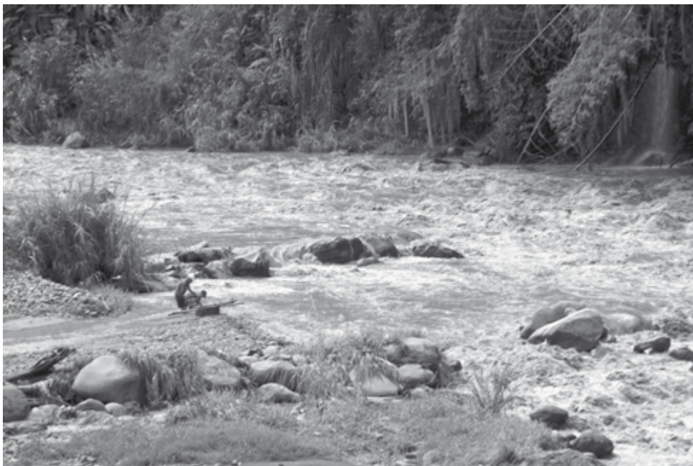
Río Chinchiná.

Las características inhospitalarias de la región paramuna inspiraron los calificativos de “La Siberia”, “El Destierro”, “Amarguras”, “La Esperanza”, “El Desquite”; y la imponentia del paisaje quedó plasmada en El “Cisne”, “El Encanto”, y “La Bella”; “Potosí”, “Los Frailes” por la abundancia de Frailejones ( Espeletia hartwegiana var. centroandina), y otros nombres como “La Palma”, “El Bosque”, “La Oliva”, “Guayabal”, “Romerales” y “Pajonales” son testimonio histórico de la diversidad vegetal. Los animales también dieron su nombre a “El Alto del Oso”, única especie suramericana de este grupo y denominada el Oso de Anteojos, hoy en proceso de extinción, “Los Cuervos”, “El Águila” y Las Dantas.