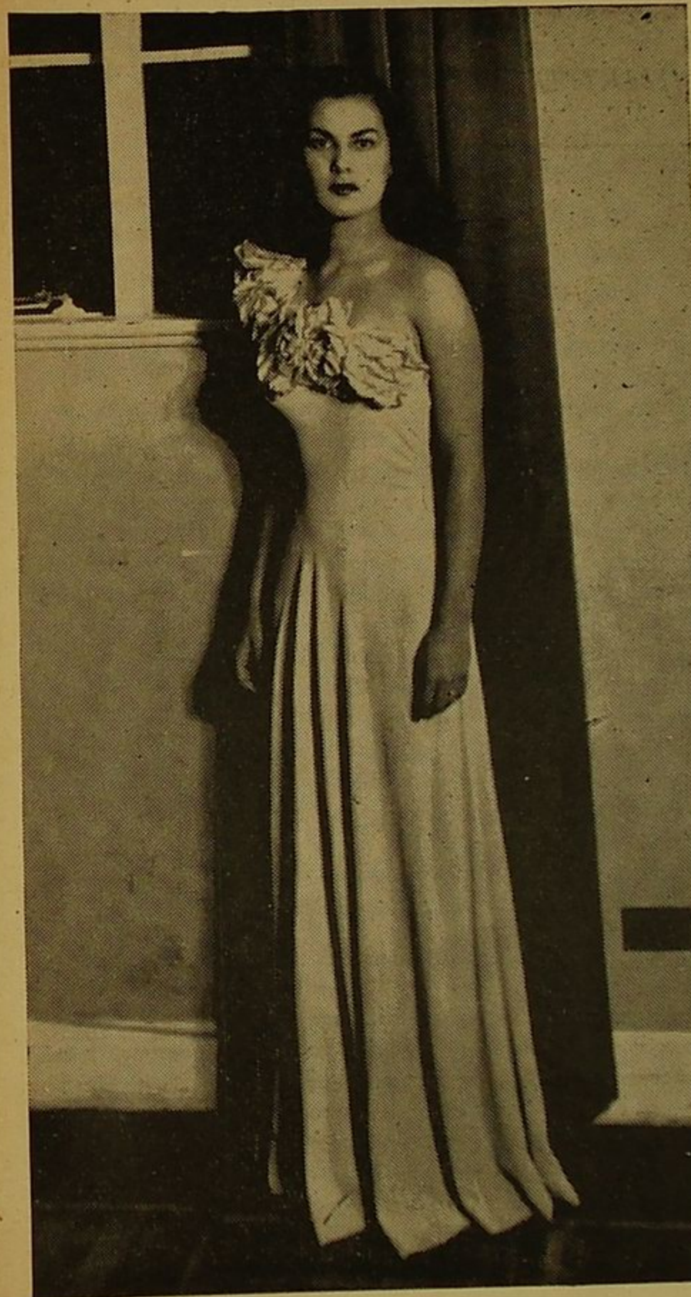
"...Esbelta y ágil, su silueta se perfila como la del mástil en la inquietud de la bahía".