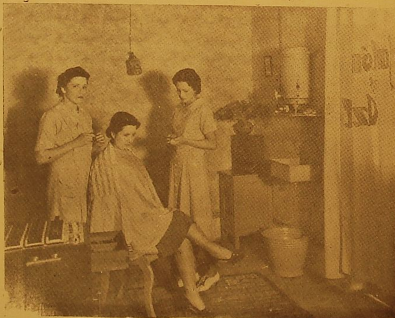
Los más modernos sistemas de rizado permanente, en frío, con aceite, masajes, peinados, manicure, etc. — Teléfono 22-89.