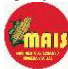
Movimiento Alternativo Indígena y Social