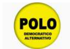
Partido Polo Democrático Alternativo