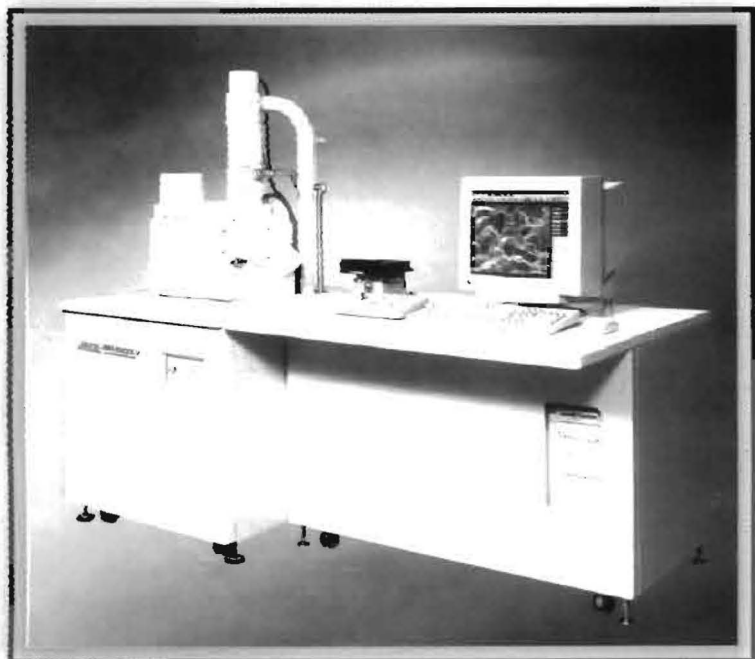
Equipos de Alta Tecnología