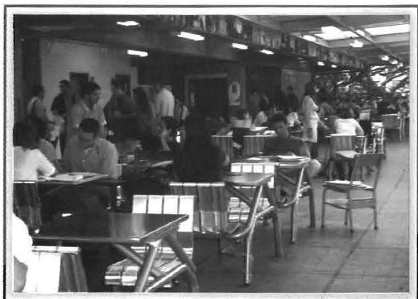
Nuevas Áreas de Estudio