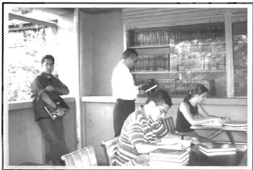
Aulas - Taller permanente de Matemáticas