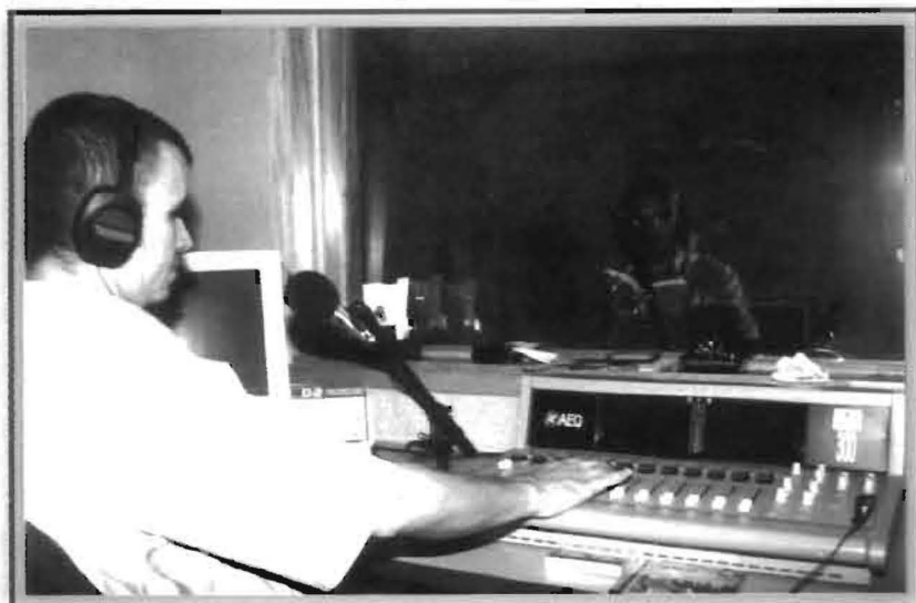
Emisora UN Radio Medellín 100.4 FM