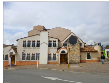
INMUEBLES N° 35 RESTAURANTE MR KING