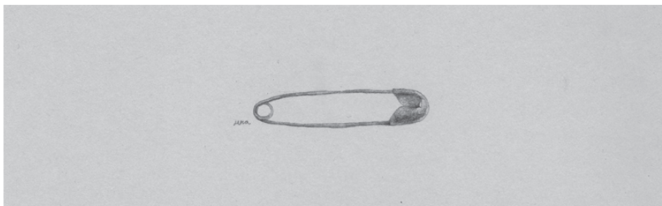
14. Ibíd. , 47.