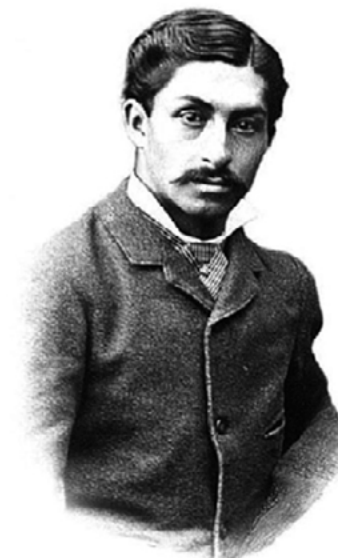
Figura 1. Daniel Alcides Carrión.

Daniel Alcides Carrión es el principal símbolo de los médicos peruanos; el 5 de octubre, en su homenaje, se celebra el día de la medicina peruana (Figura 1) (1,2).