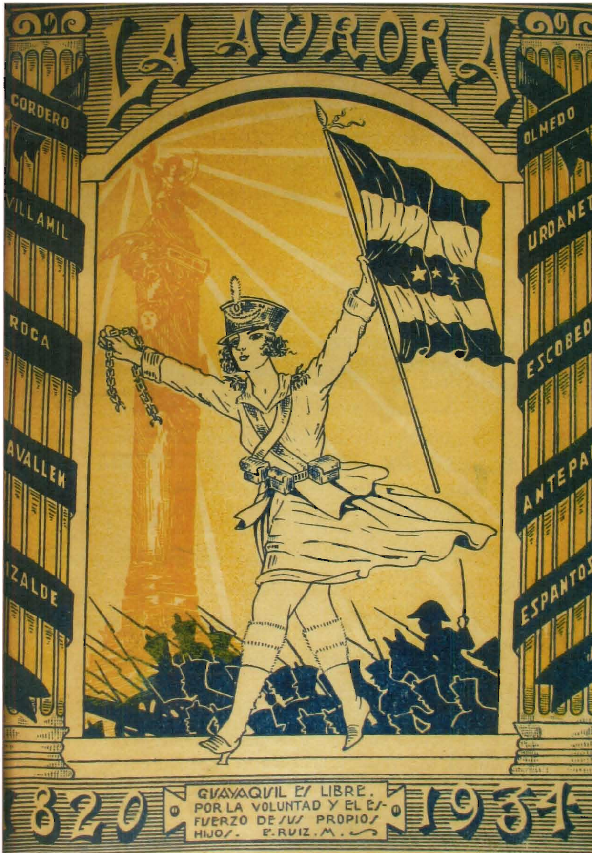
Figura 85: Página anterior. "Confraternidad chileno-ecuatoriana", revista Patria N° 7, Guayaquil 8 de septiembre de 1907.