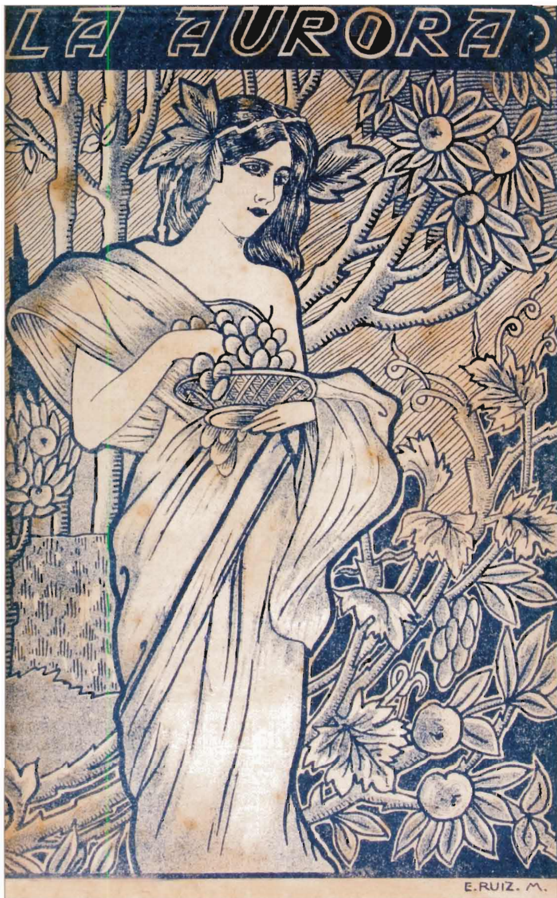
Figura 90: Revista La Aurora N° 108, Cuyavaquil, julio de 1935. Autor dibujo Eduardo Ruiz.