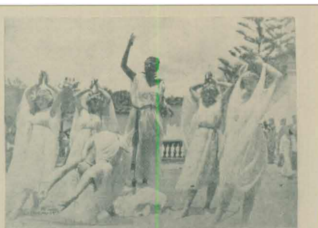
La Danza de la Paz

Figura 87: Portada revista La Aurora N° 272. Guayaquil, diciembre, 1921.