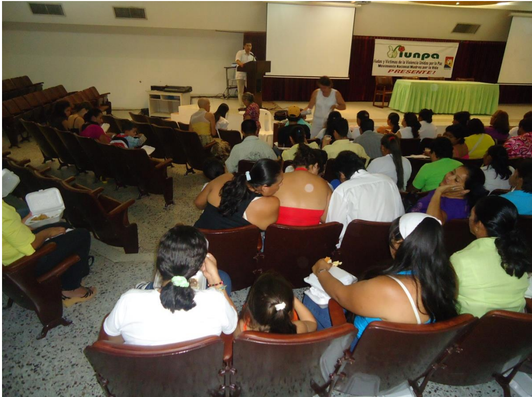
Entrevista a Víctimas del Conflicto de la Región Surcolombiana