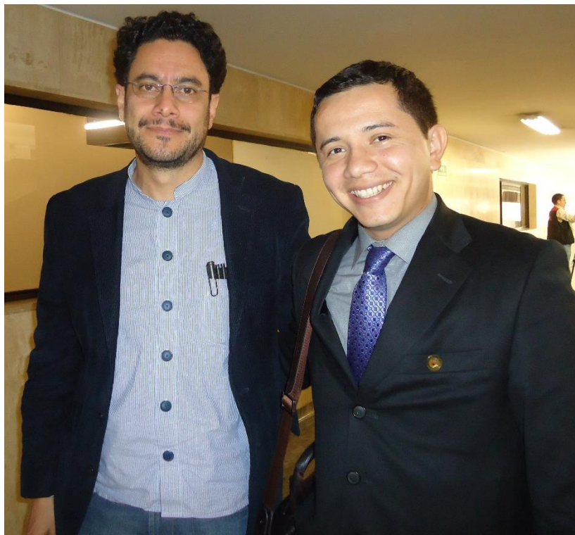
Entrevista realizada a Iván Cepeda Castro: Representante Cámara por el Polo Democrático Alternativo. Es un político y defensor de derechos humanos colombiano, filósofo, hoy representante a la Cámara. Es el vocero oficial del Movimiento de Víctimas de Crímenes de Estado (MOVICE).