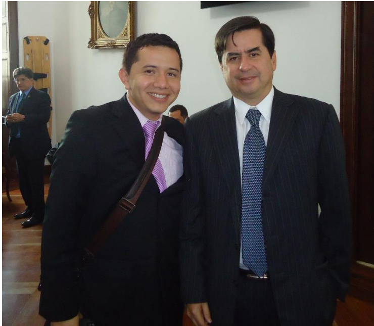
Entrevista Realizada a Juan Fernando Cristo, Abogado y político colombiano. Militante del Partido Liberal Senador de Colombia desde 1998, y Exministro del Interior 2014 del Gobierno de Juan Manuel Santos.