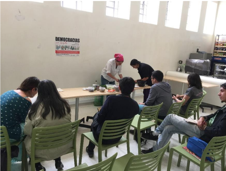
Fotografía 5 Taller de cocina tradicional