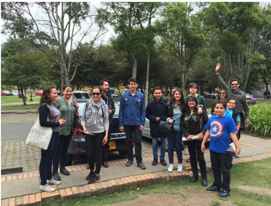
Fotografía 1. Recorrido con familias del sector

Entre los aprendizajes de este trabajo se encuentra también la relevancia del trabajo en equipo, la importancia de analizar la información recolectada y hacer gestión del conocimiento. Es fundamental para el avance del campo museológico en Colombia que procesemos la información y la compartamos para que se convierta en insumo para avanzar. Así no nos quedamos mediando en el olvido.