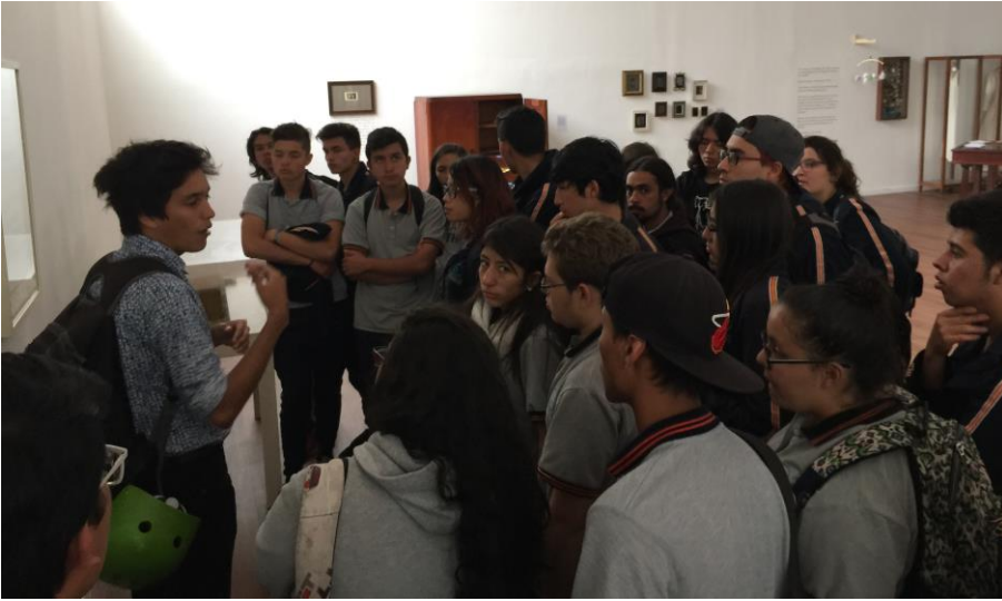
Fotografía 2. Mediación con público escolar