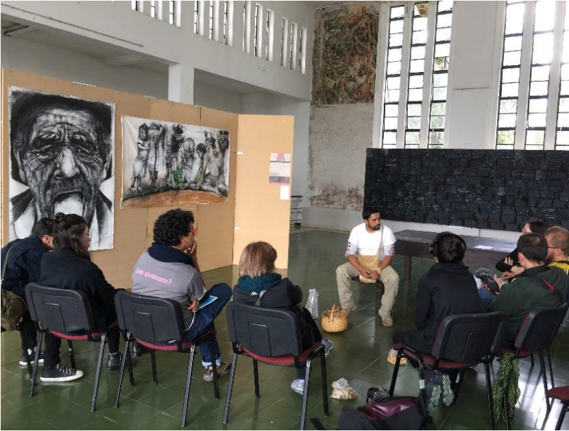
Fotografía 6. Taller de intercambio de semillas