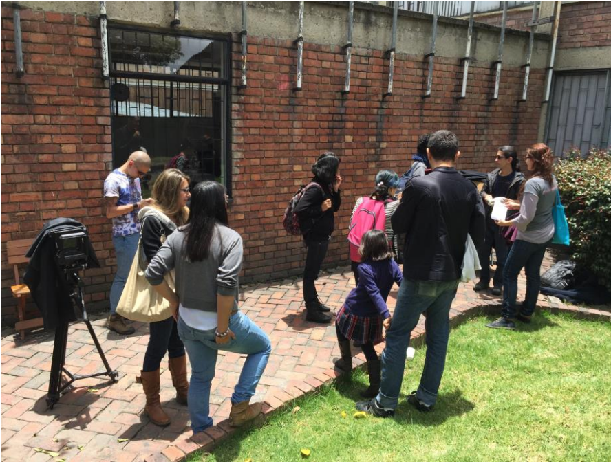
Fotografía 4 Taller de fotografía antigua.