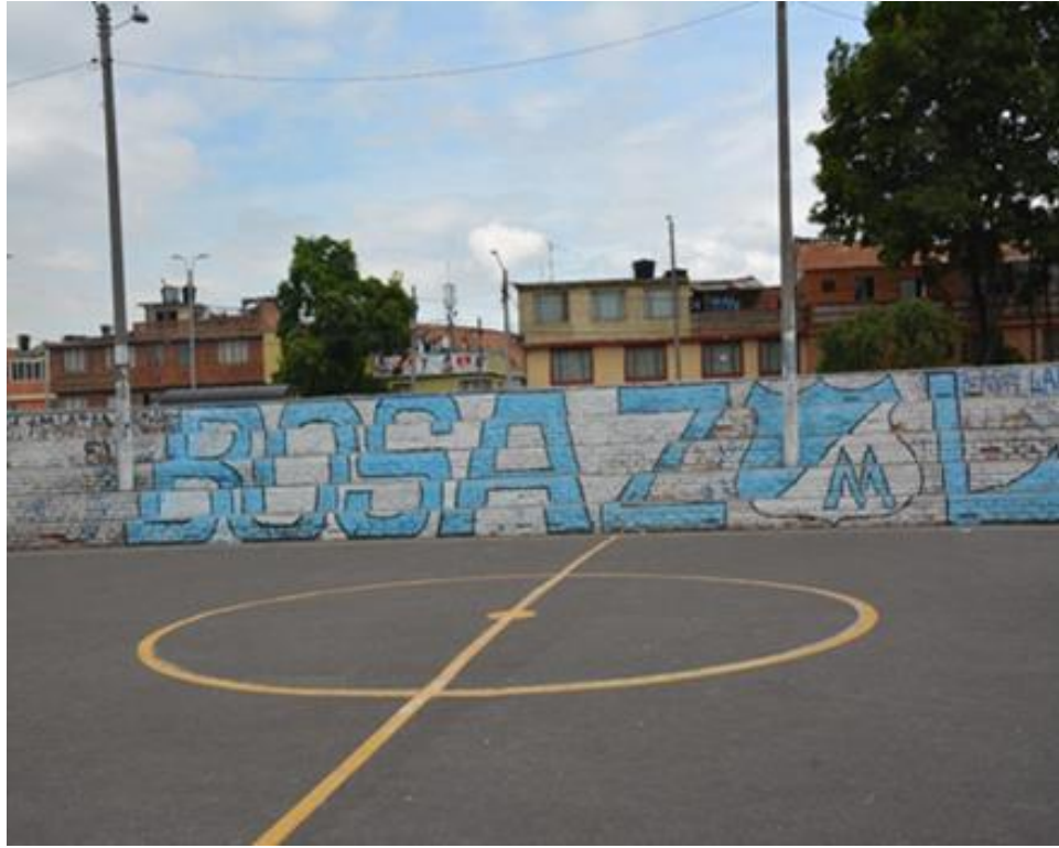
Imagen 9: Mural parque los Naranjos

Nombre de la foto: Mural parque los Naranjos.