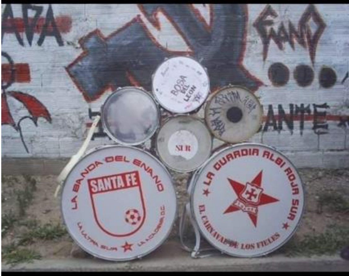
Imagen 22: Mural y murga del enano.

Nombre de la foto: Mural y murga del enano.