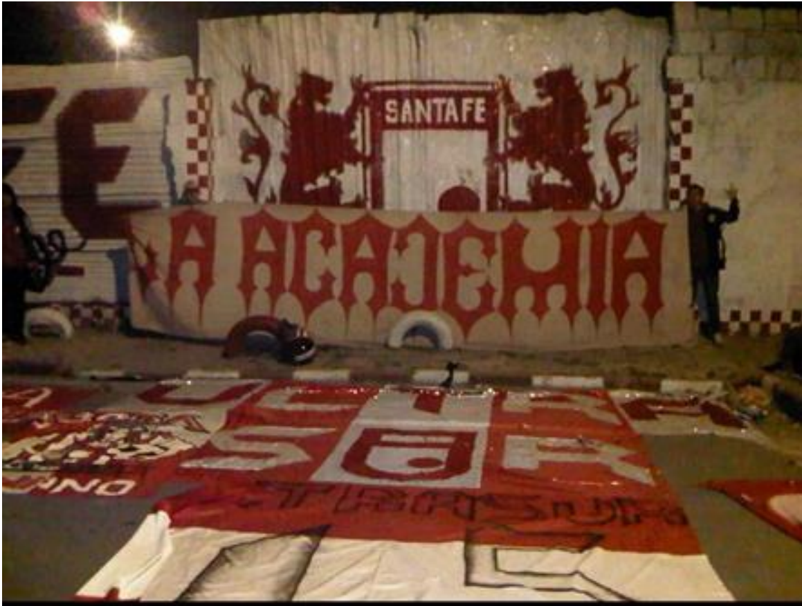
Imagen 23: Trapos mural del enano.

Nombre de la foto: Trapos mural del enano.