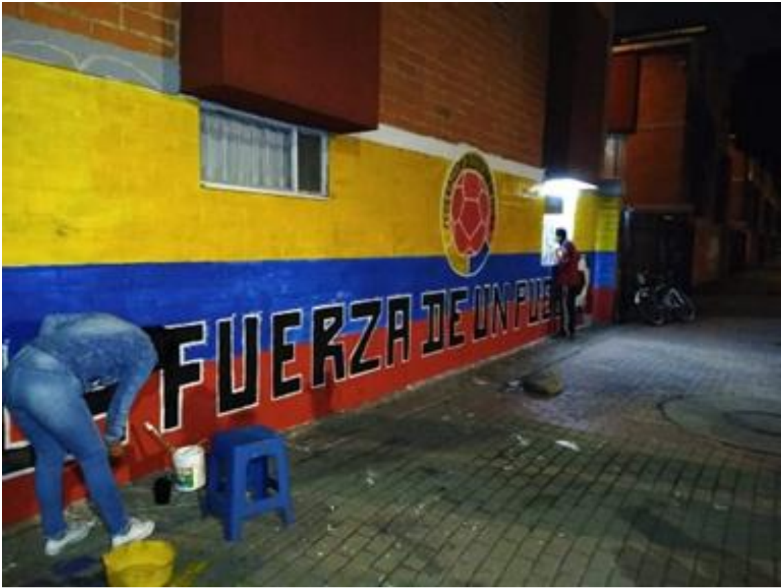
Imagen 30: Bosa Centro Enano Santa fé.

Nombre de la foto: Bosa Centro Enano Santa fé.