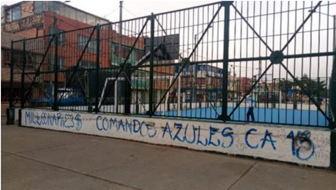
Imagen 13: Comando parque naranjos

Nombre de la foto: Comando parque naranjos