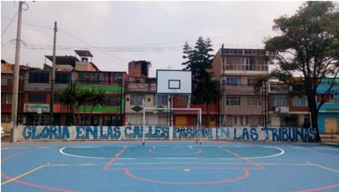
Imagen 11: Bosa Parque Comandos