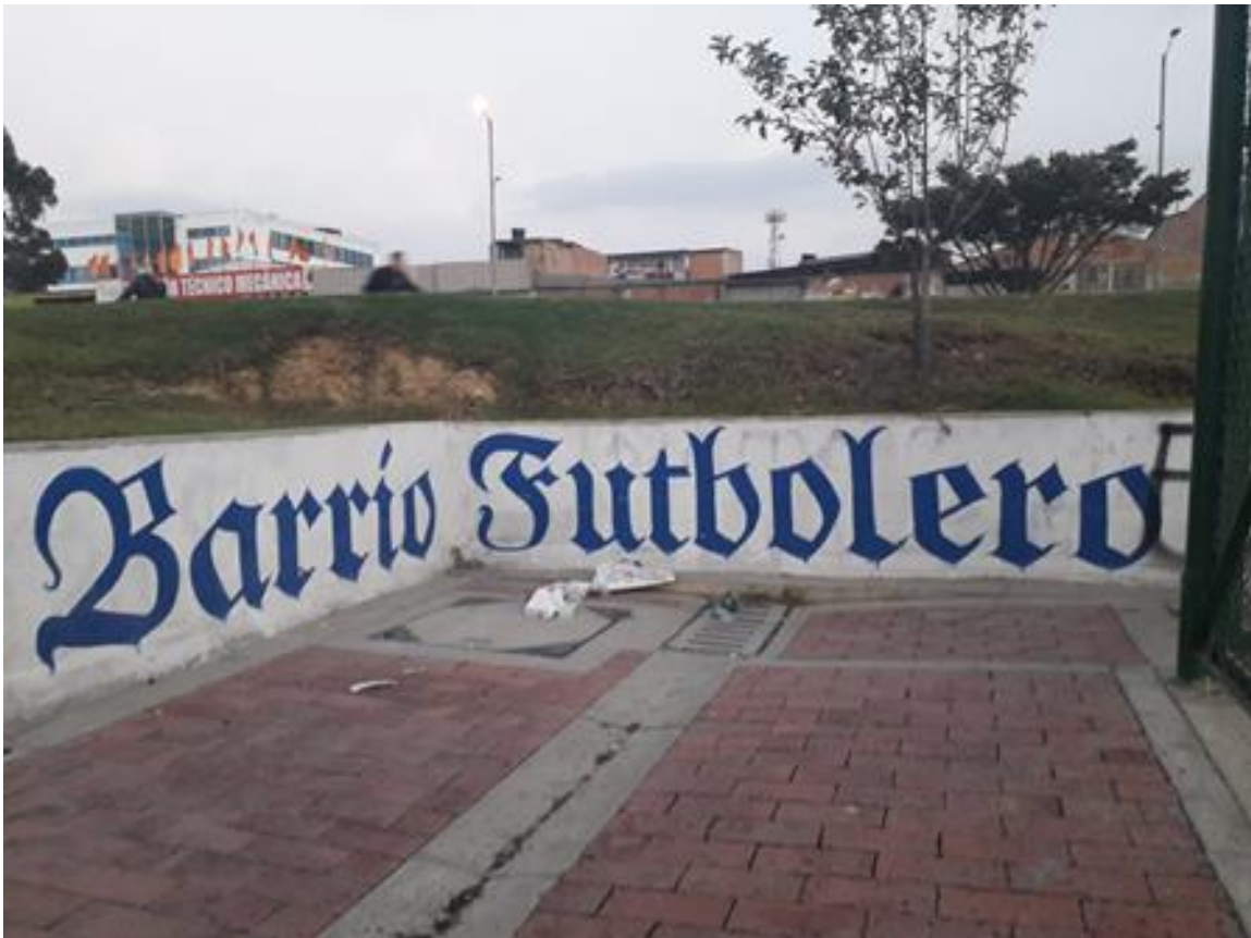
Imagen 10: Bosa Parque Chicala.