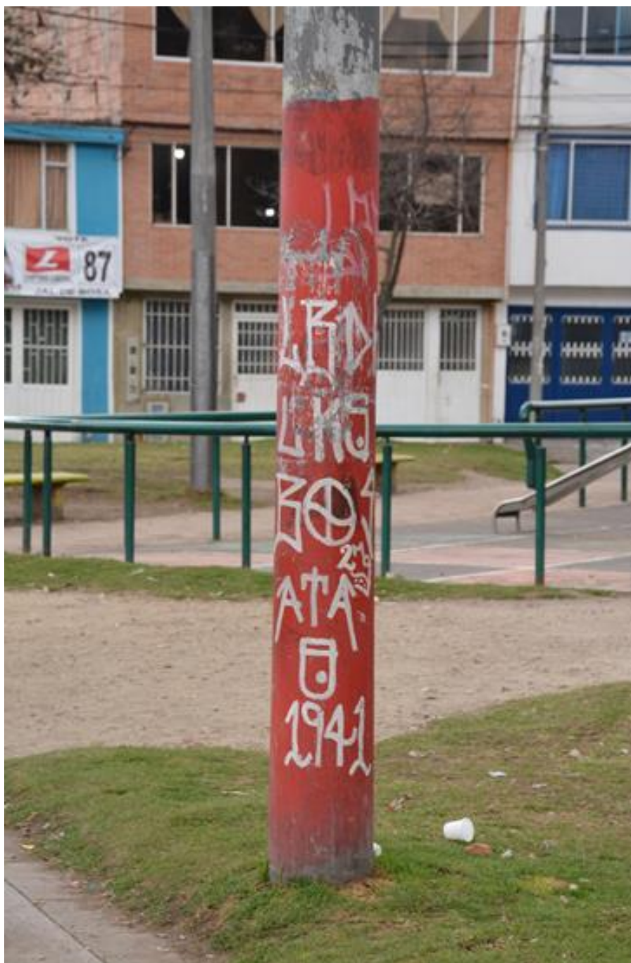
Imagen 5: Grafiti en poste de luz

Nombre de la foto: Grafiti en poste de luz