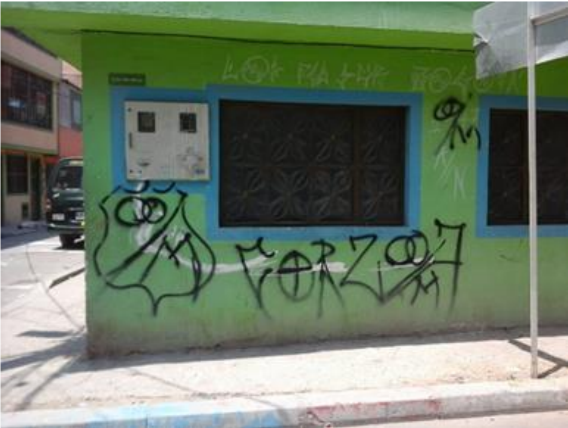
Imagen 26: Nacional sobre Millonarios, Bosa Santa Fe.

Nombre de la foto: Nacional sobre Millonarios, Bosa Santa Fe.