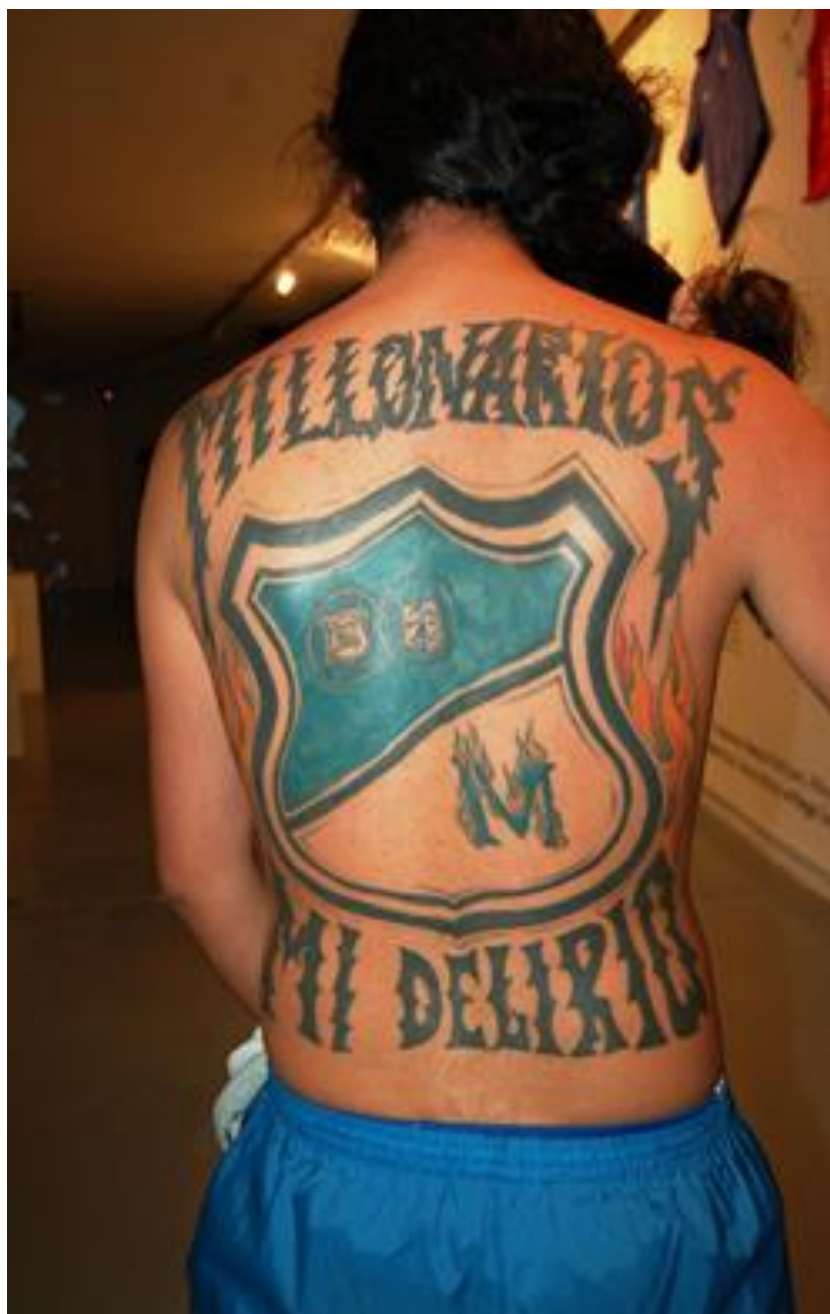
Imagen 7: tatuaje.

Nombre de la foto: tatuaje. Fecha: 15 de abril de 2018