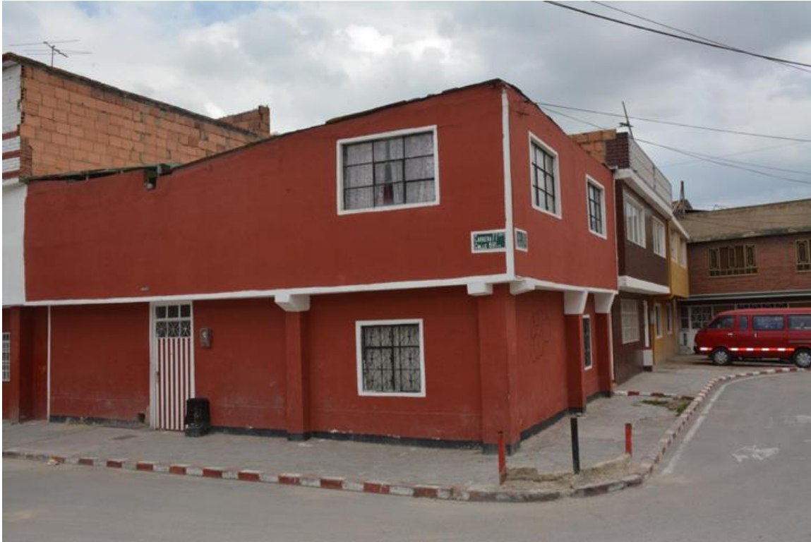
Imagen 17: Casa Insignia 'El Enano' Santa Fe.

Nombre de la foto: Casa Insignia 'El Enano' Santa Fe.