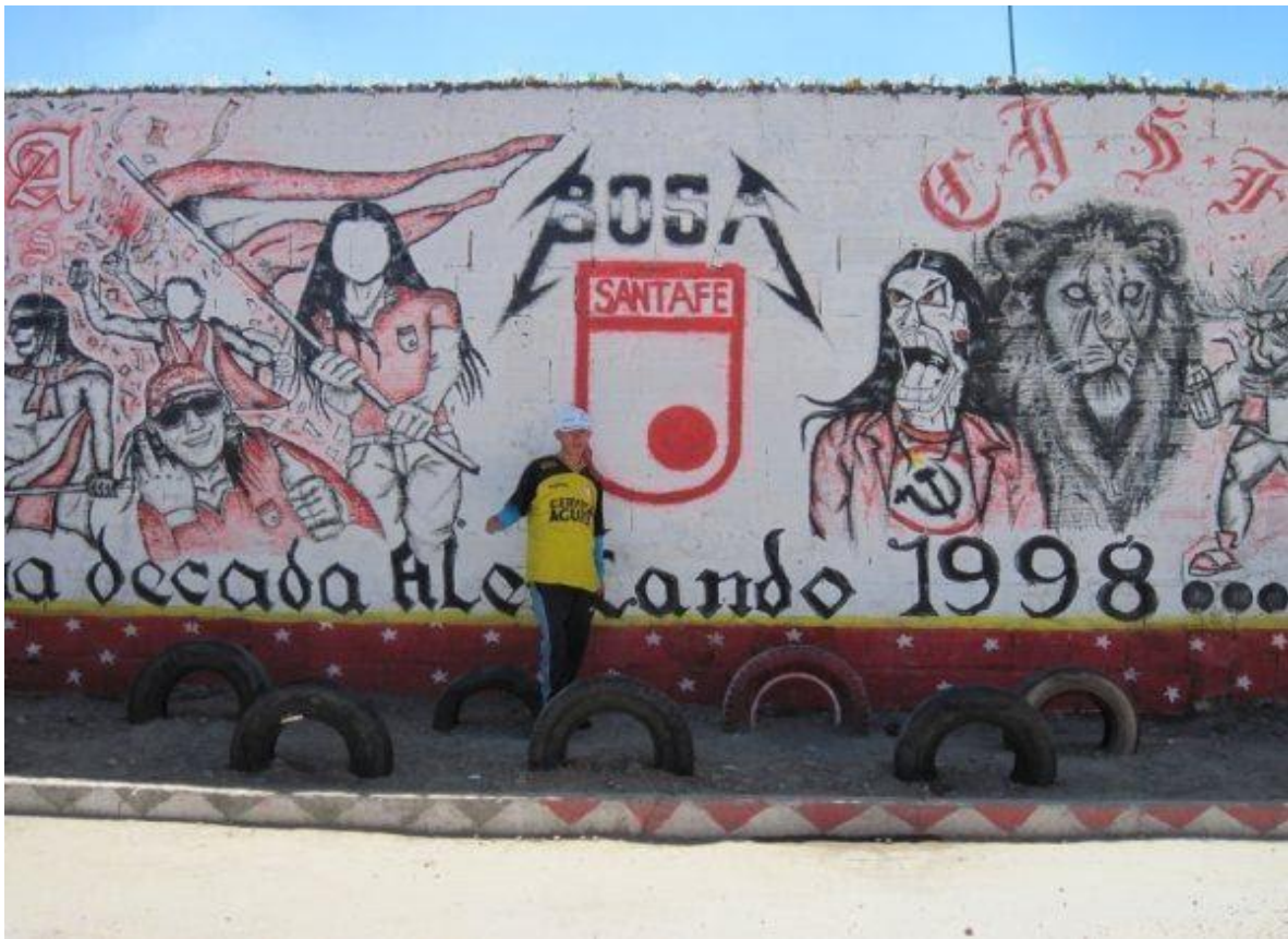
Imagen 6: Mural de la barra de Santa Fe