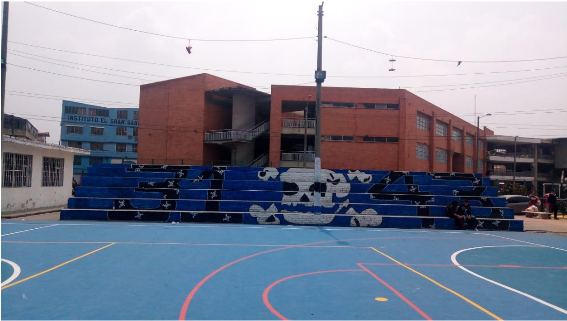
Imagen 1: Bosa comandos amistad

Nombre de la foto: Bosa comandos amistad