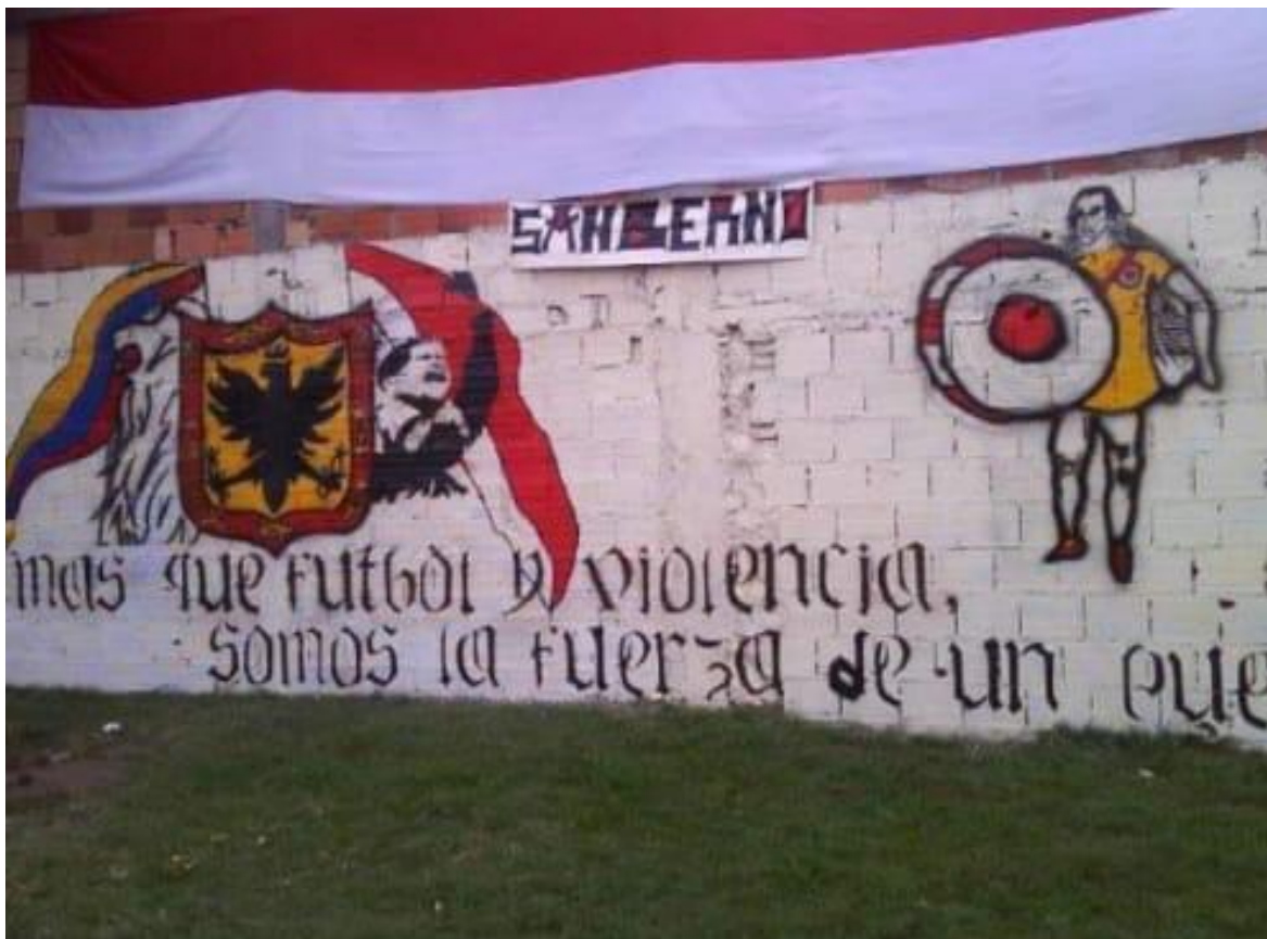
Imagen 18: Mural al lado de la casa del enano.

Nombre de la foto: Mural al lado de la casa del enano.