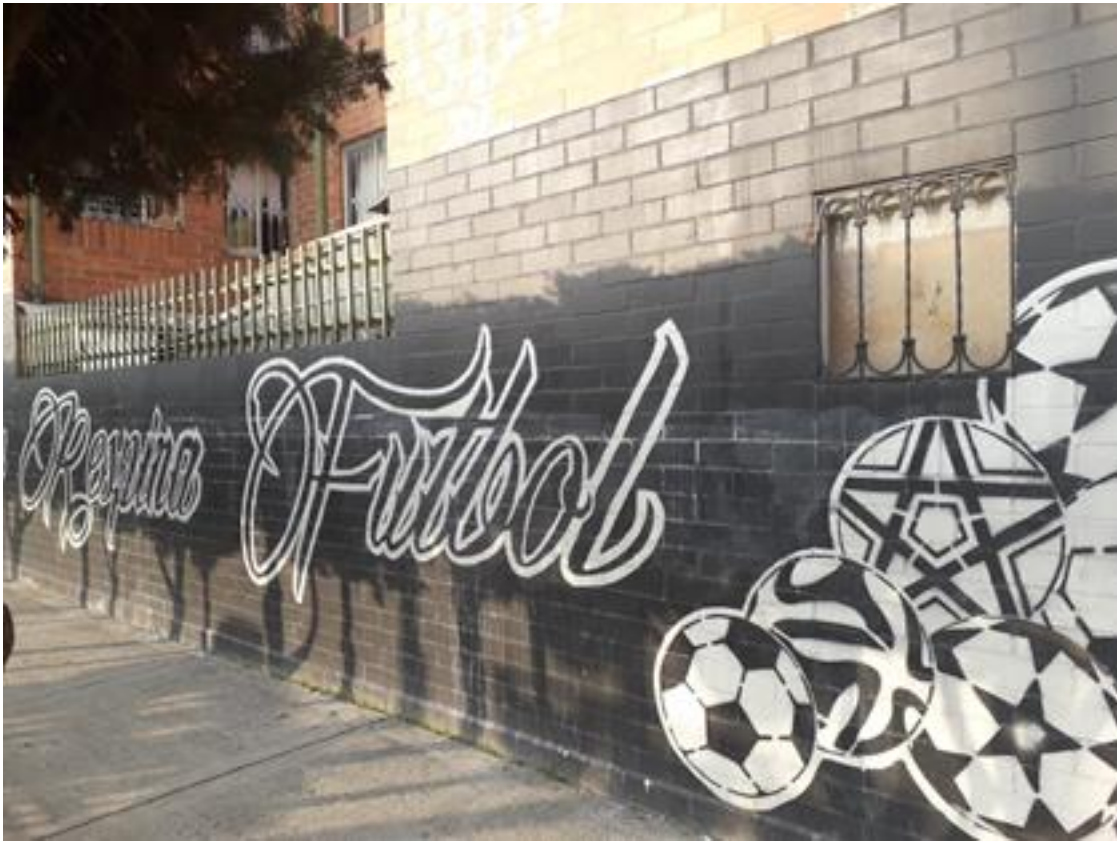
Imagen 32: Chicala respira Futbol Millos.

Nombre de la foto: Chicala respira Futbol Millos.