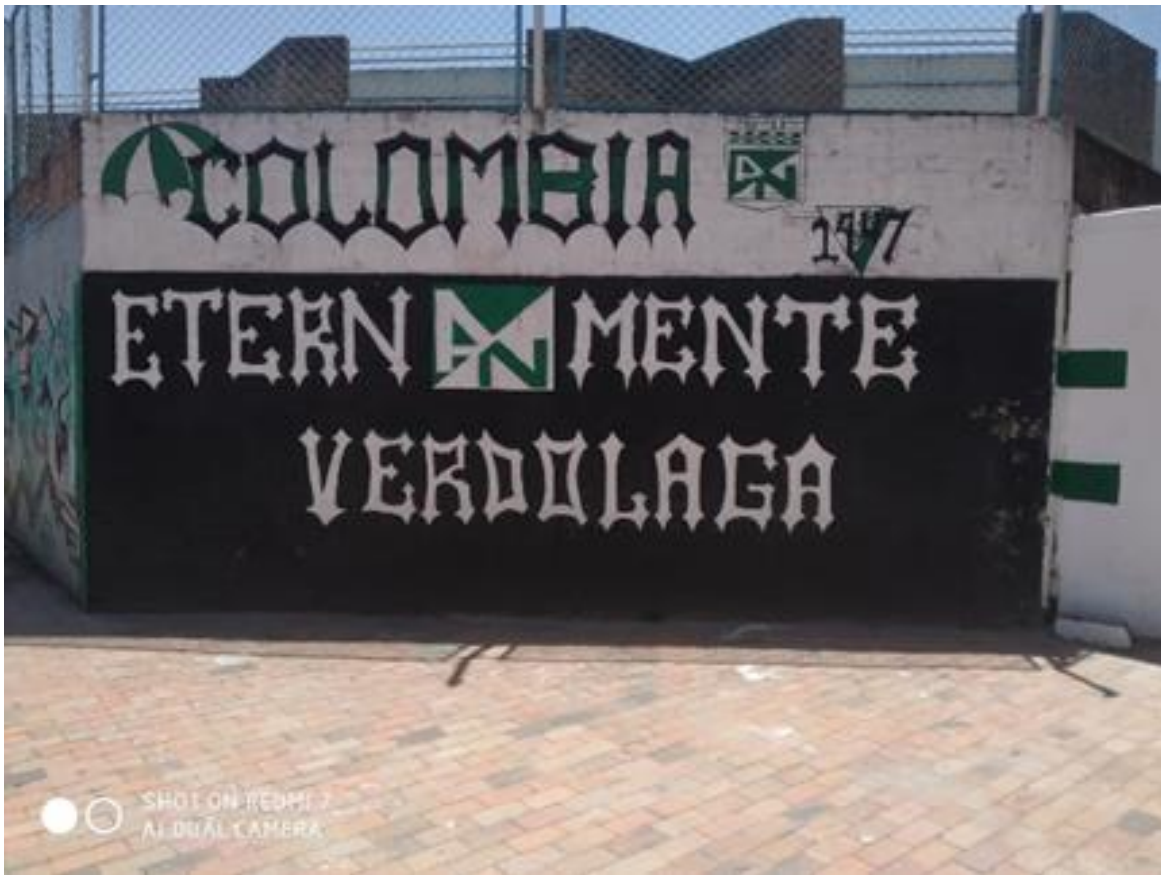
Imagen 14: Parque los del sur naranjos

Nombre de la foto: Parque los del sur naranjos