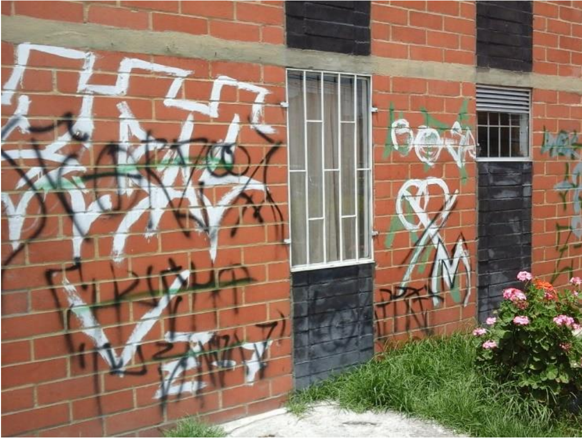
Imagen 4: Bosa Brasil Millos a Nacional.

Nombre de la foto: Bosa Brasil Millos a Nacional.