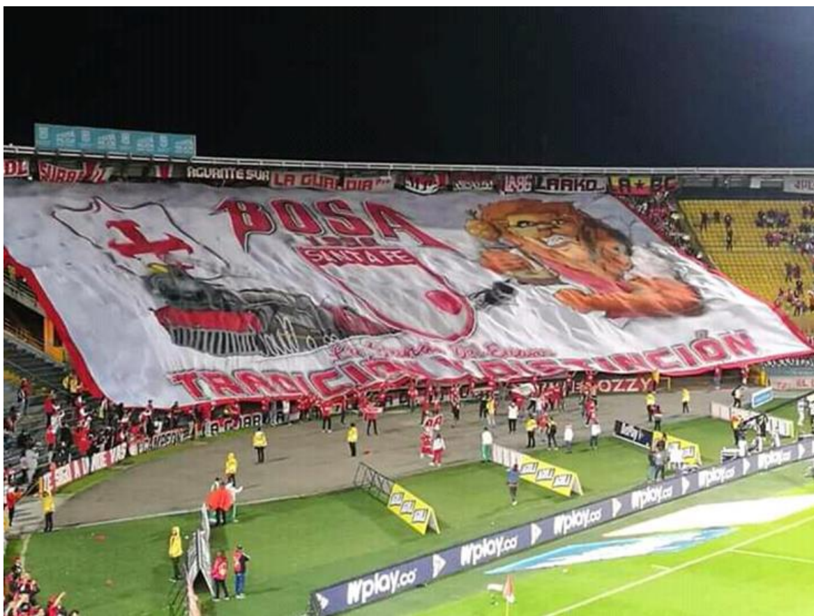
Imagen 19: Frente de Santa Fe