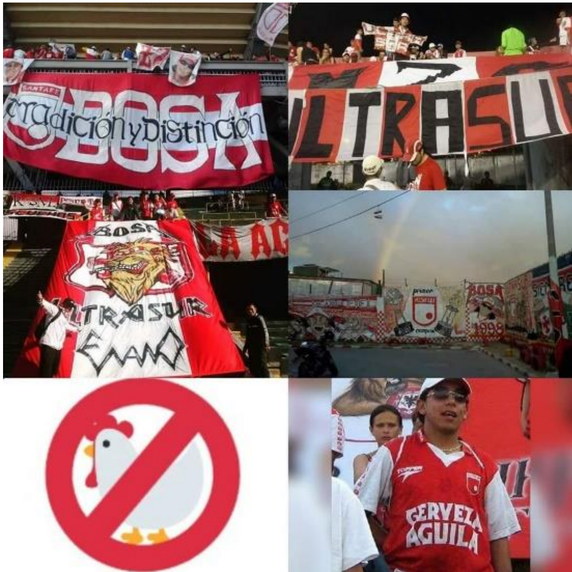
Imagen 21: Homenaje al enano