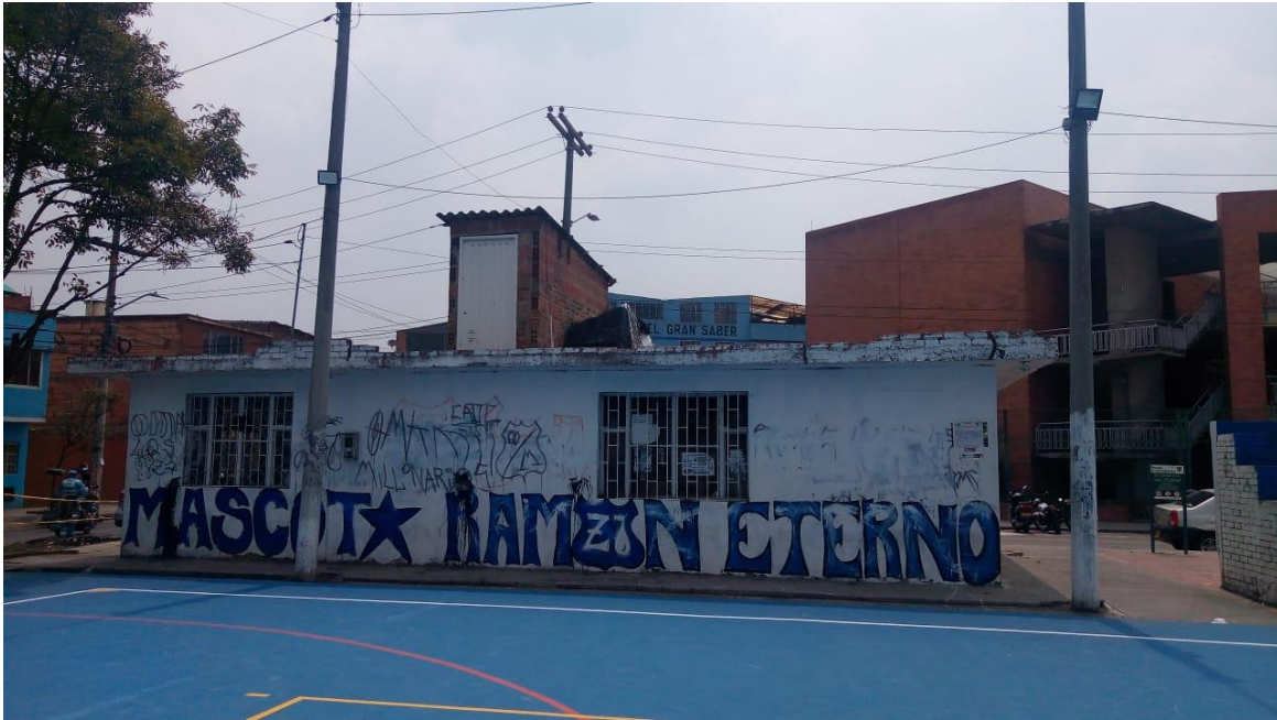
Imagen 2: Bosa Amistad colegio