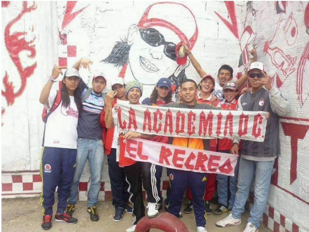
Imagen 20: Bosa parche banda del enano.

Nombre de la foto: Bosa parche banda del enano.