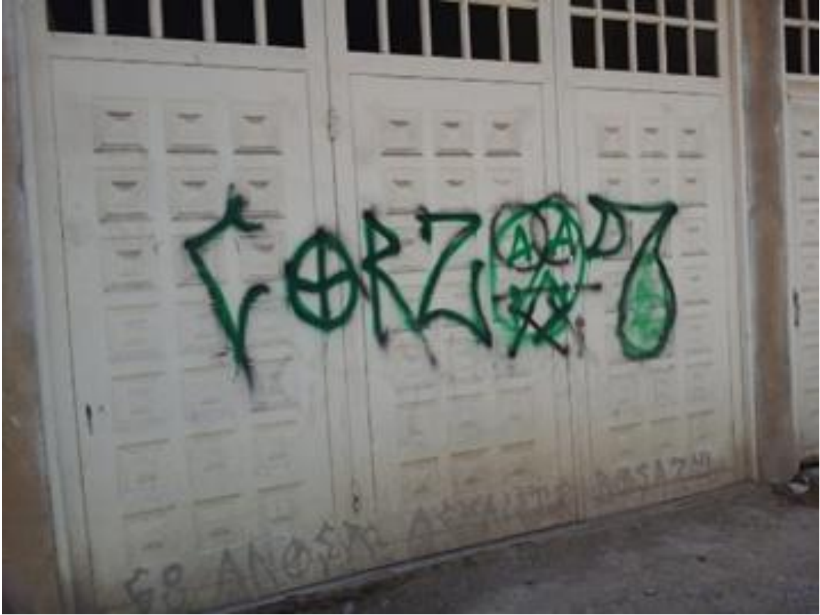
Imagen 25: Pinta dominada Nacional a Millos, Bosa Santa Fe.

Nombre de la foto: Pinta dominada Nacional a Millos, Bosa Santa Fe.