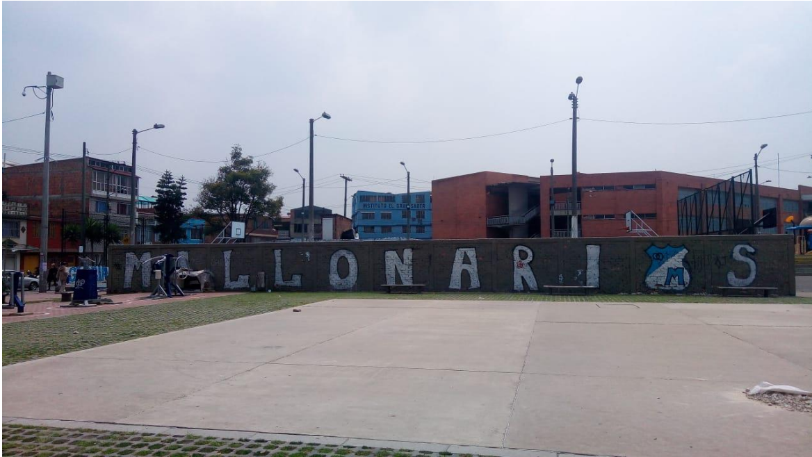
Imagen 16: Bosa Brasil colegio.