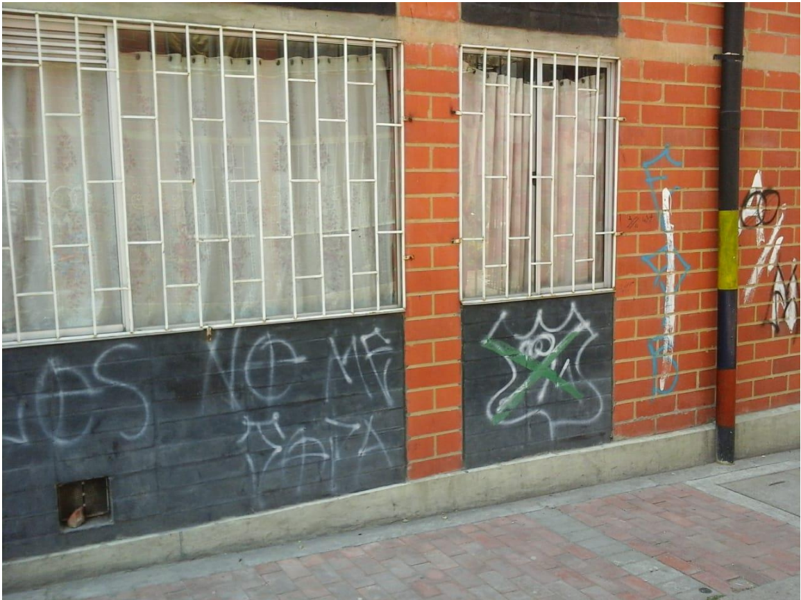
Imagen 3: Bosa Brasil Nacional a Millos

Nombre de la foto: Bosa Brasil Nacional a Millos