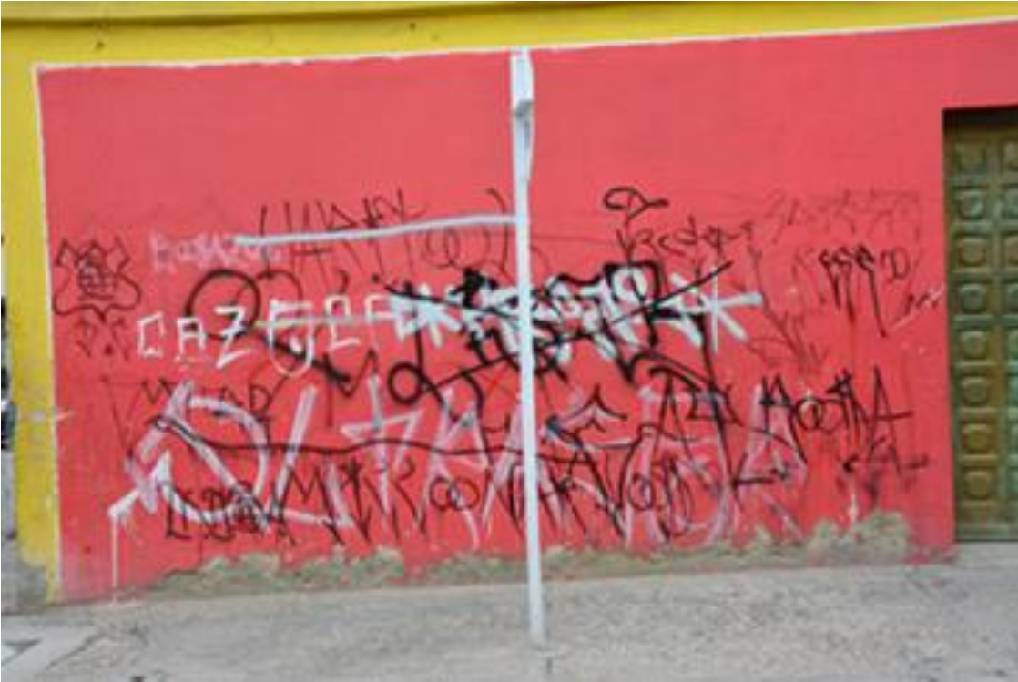
Imagen 24: Re-escritura de grafitis

Nombre de la foto: Re-escritura de grafitis