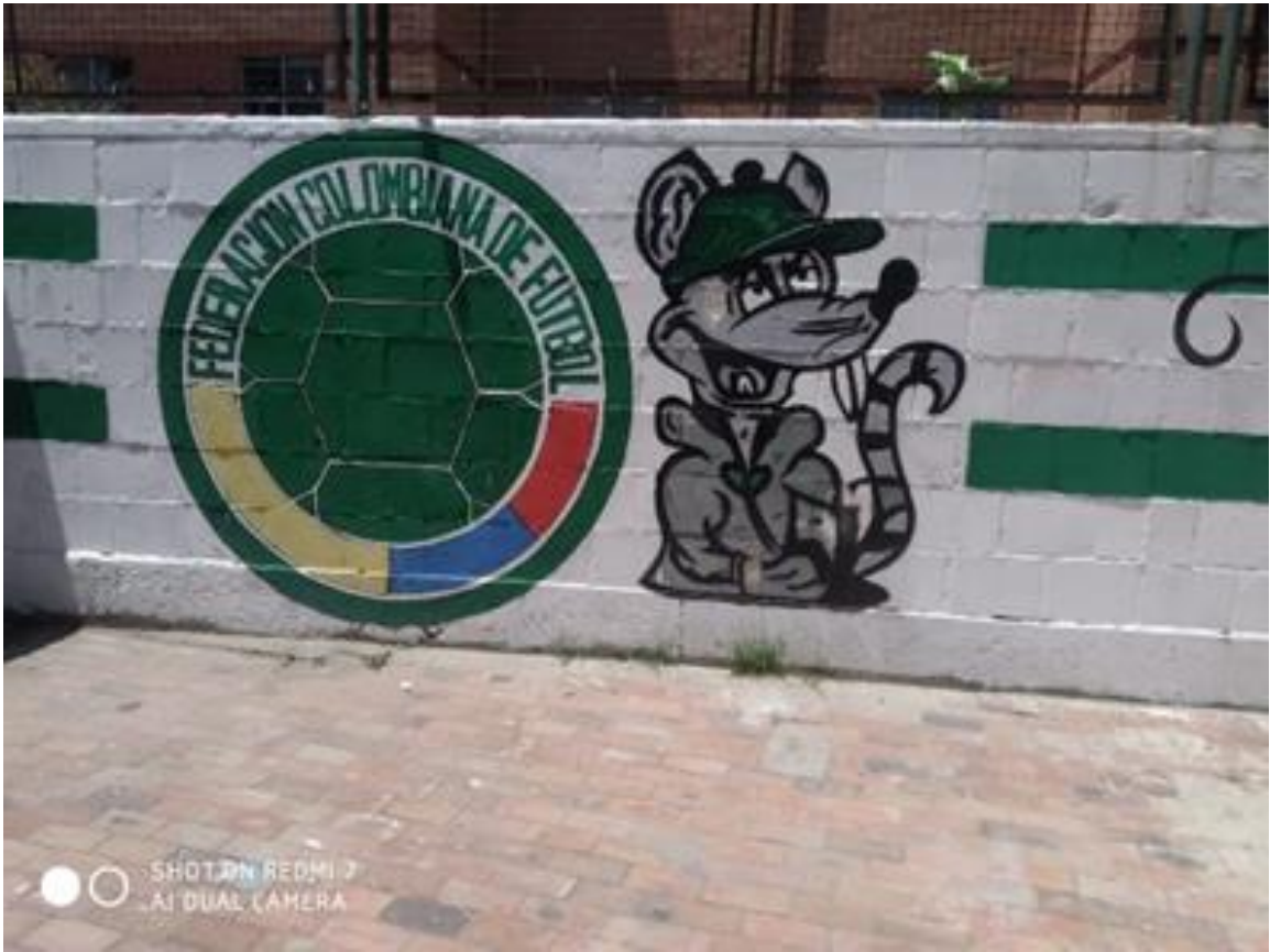
Imagen 31: Bosa Nacional Los Naranjos.

Nombre de la foto: Bosa Nacional Los Naranjos.