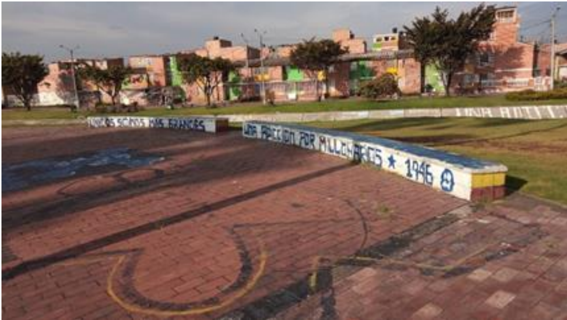
Imagen 12: Bosa Recreo parque Blu

Nombre de la foto: Bosa Recreo parque Blu