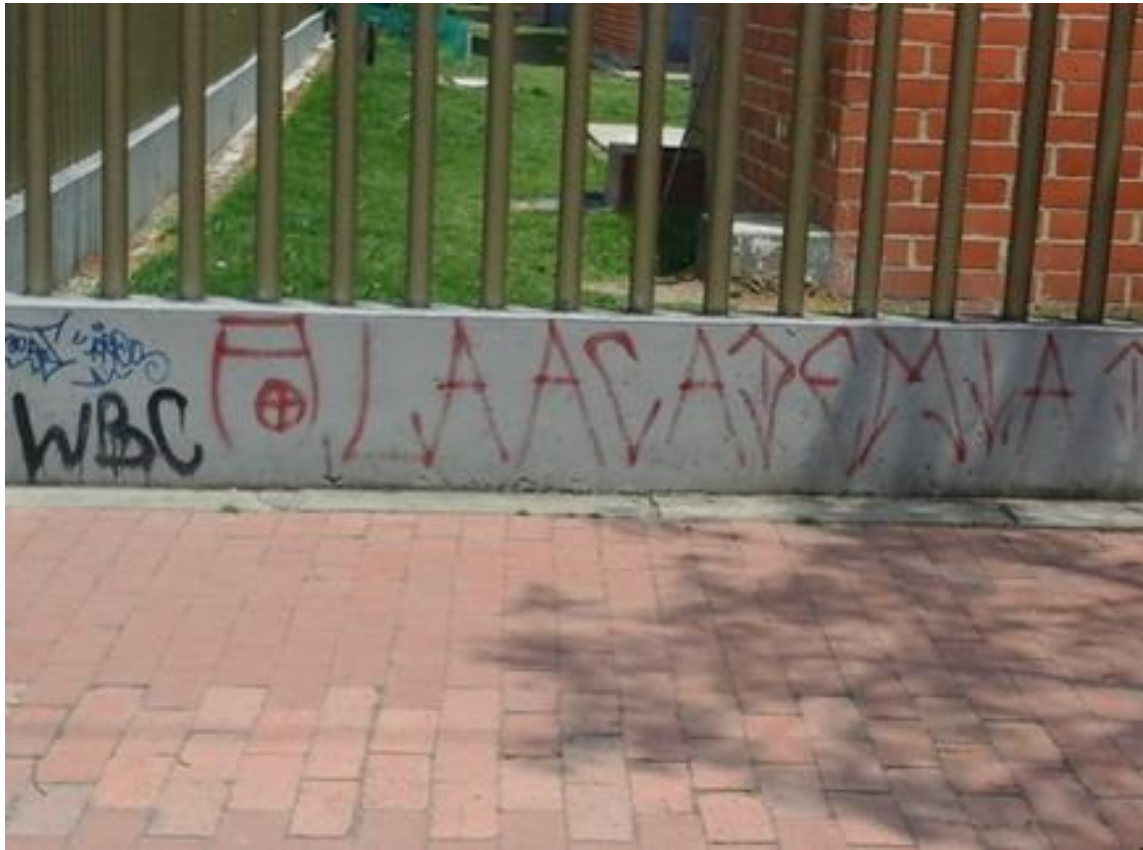
Imagen 28: Bosa Mariland, barra Santa Fe

Nombre de la foto: Bosa Mariland, barra Santa Fe