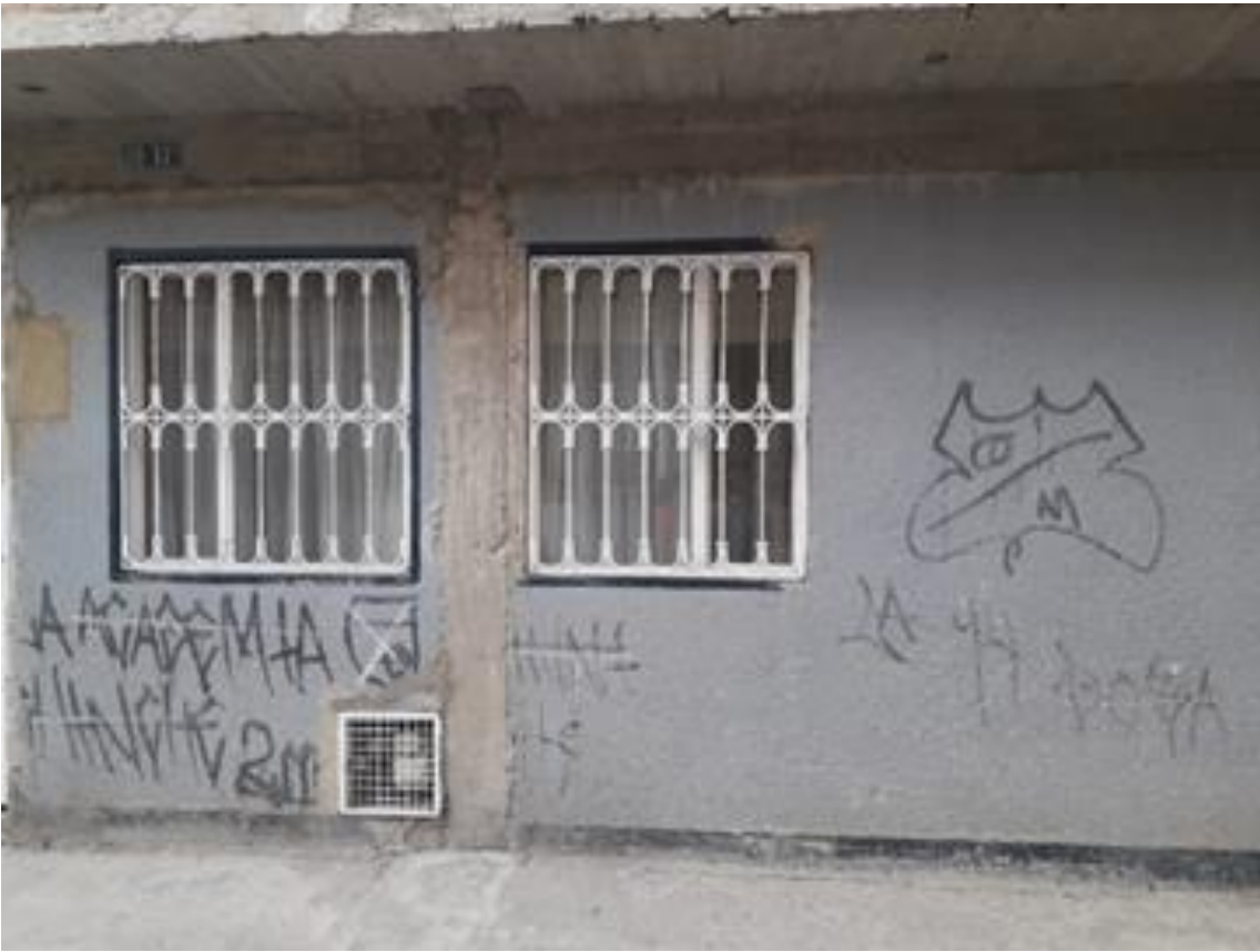
Imagen 27: Chicala frontera Millos Santa Fe.

Nombre de la foto: Chicala frontera Millos Santa Fe.