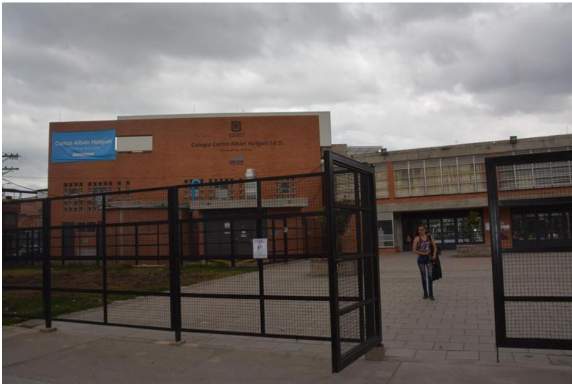
Imagen 15: Colegio Carlos Alban Holguín

de Bosa se encuentra ubicado cerca a la plaza fundacional y está dominado principalmente por la barra de Millonarios.