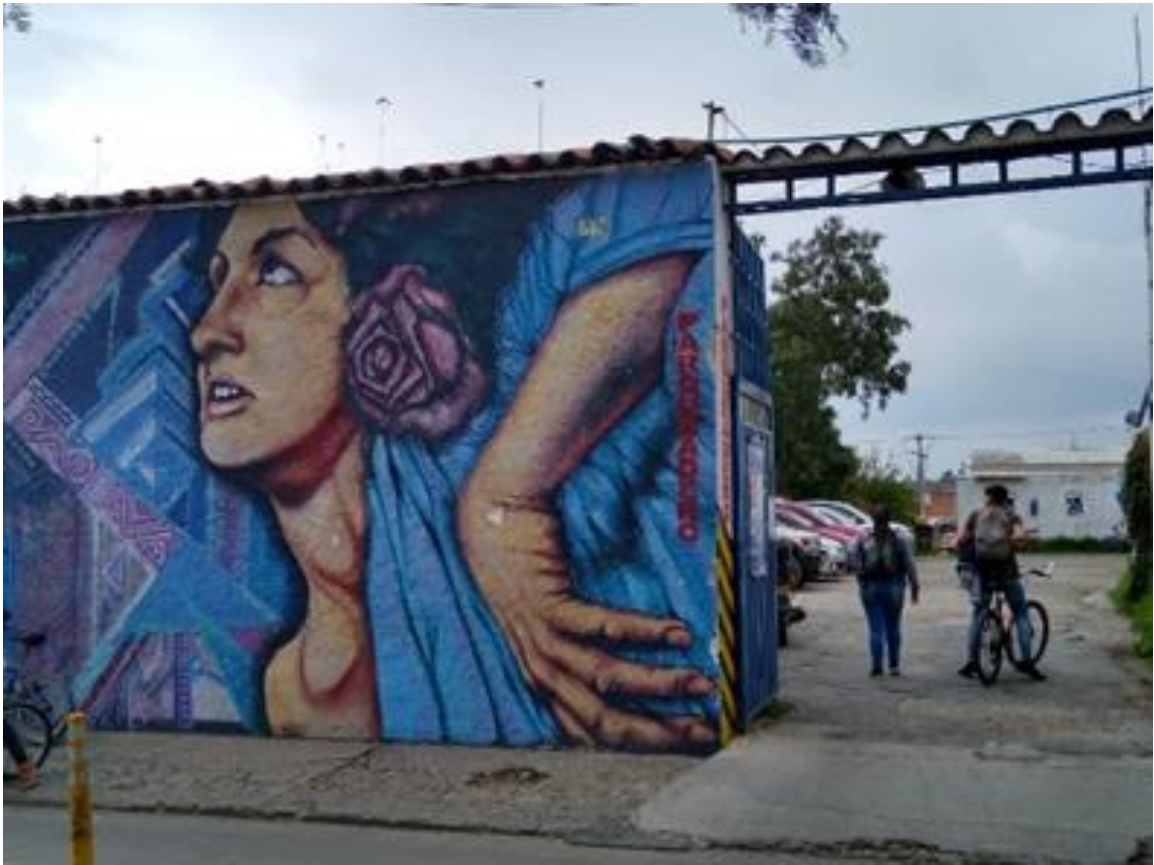
Imagen 29: Mural Millos Plaza Fundacional.

Nombre de la foto: Mural Millos Plaza Fundacional.