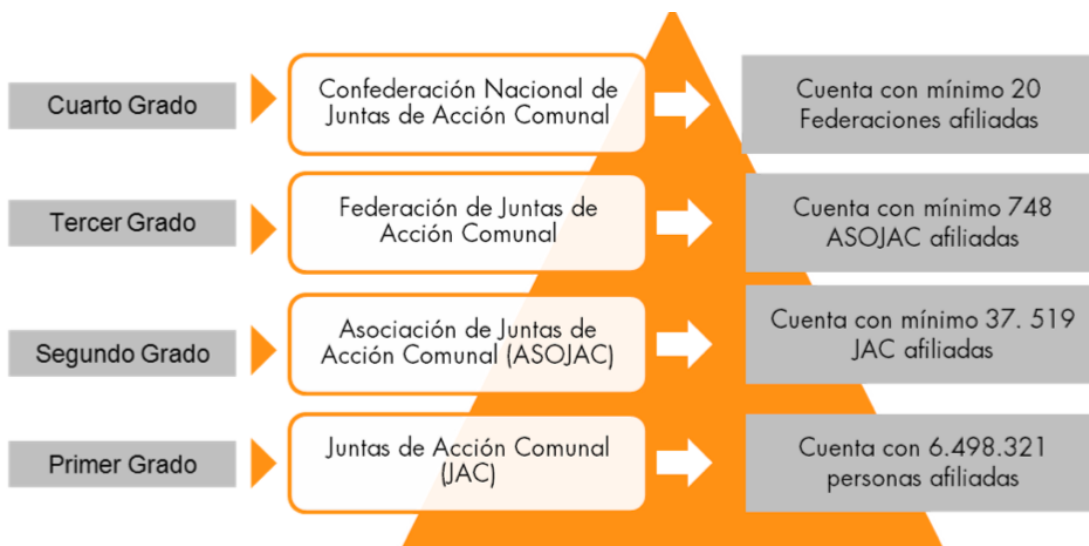
Figura 1. Tipología de la Acción Comunal en Colombia

Dados los alcances y dimensiones que adoptó esta forma de organización, desde el Estado se ha promovido una correspondiente expansión de los niveles de institucionalización, que si bien no son el foco principal de esta tesis, se incluyen en el siguiente cuadro de manera ilustrativa, sobre cómo las Juntas de Acción Comunal y sus diferentes formas de influencia, han supuesto re pensar su idea original.