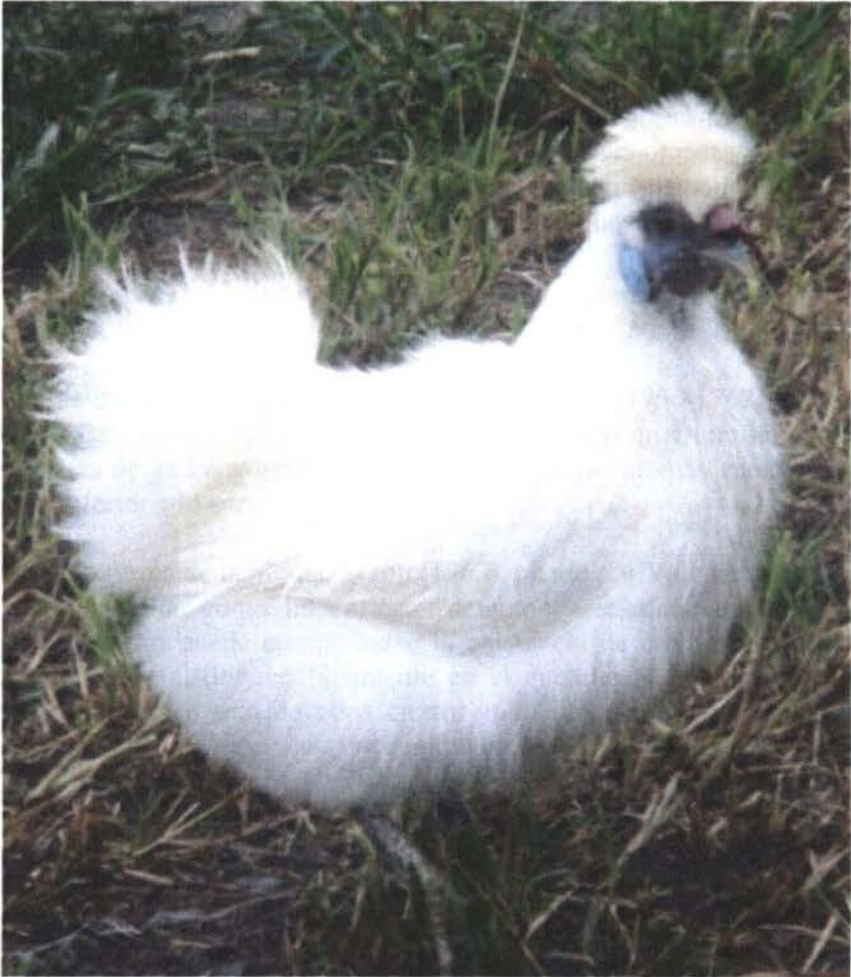
Figura 7: Gallus domesticus L. subespecie lanatus n.l. "de pelo"