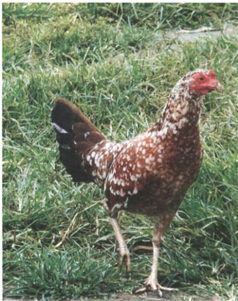
Figura 10: Gallus domesticus L. subespecie pugnax n.l. "fina" (Foto: Valencia LI, N.F)