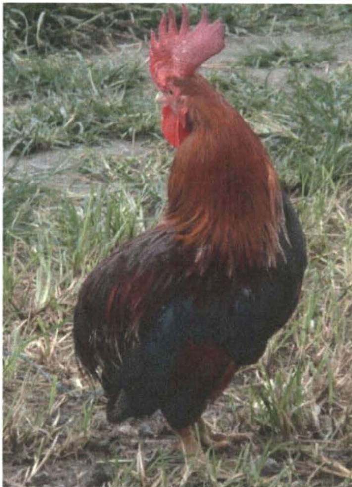
Figura 4: Gallus domesticus L. subespecie ecaudatus n.l. "tapuncha"