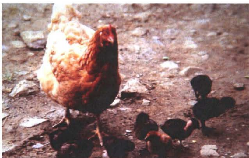
Crianza natural. La cloquera y habilidad materna: características sobresalientes de la gallina criolla.