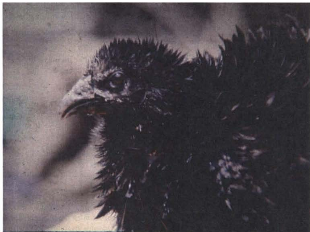
Figura 11.1: Cruzamiento entre Gallus domesticus L. subsps: morio * crispus .