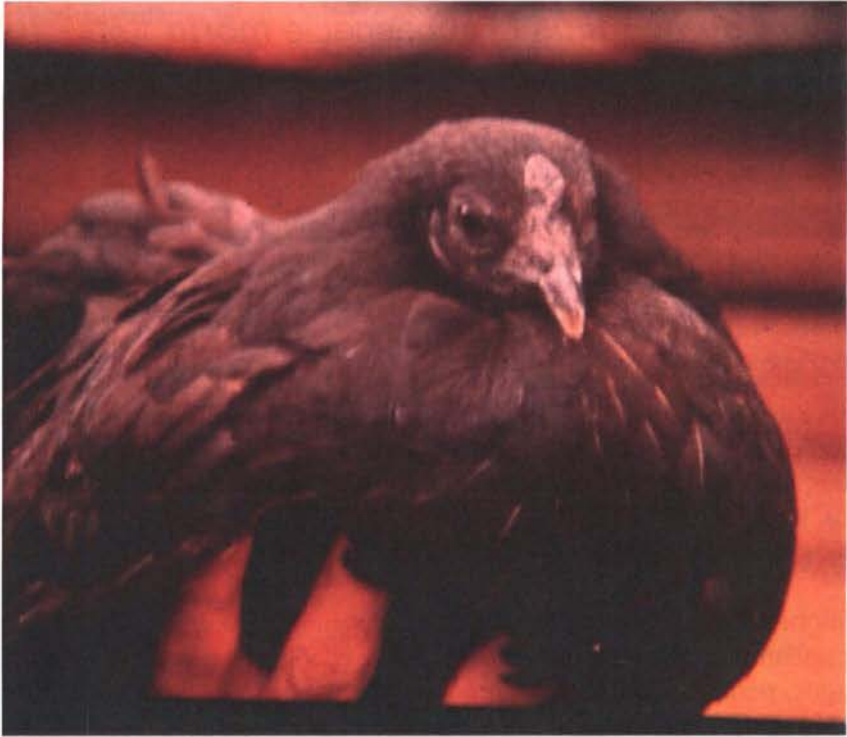
Figura 11: Gallus domesticus L. subespecie morio n.l. "nicaragua"