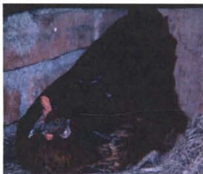
Gallina en estado de cloquera