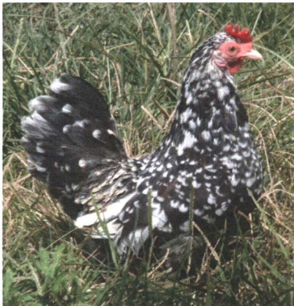
Figura 13: Gallus domesticus L. subespecie nanus n.l. "cubana"