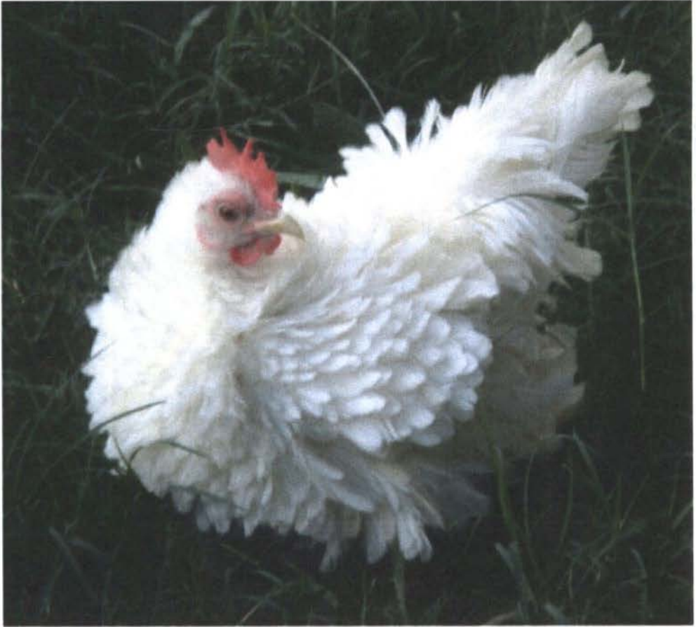
Figura 14: Gallus domesticus L. subespecie nanus variedad rizada