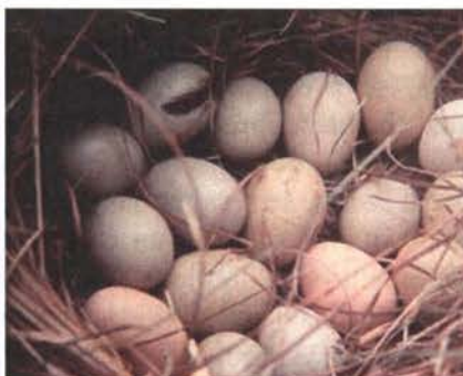
Preparación del inicio y selección de huevos fértiles