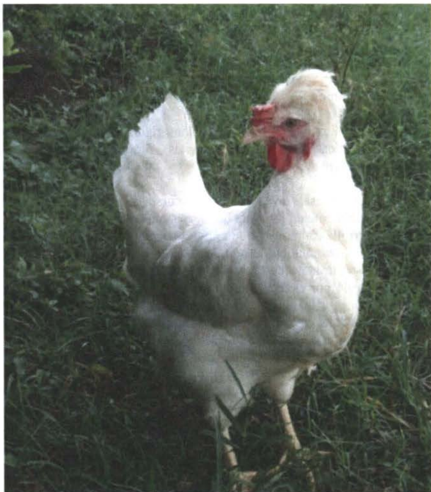
Figura 9: Gallus domesticus L. subespecie cristatus n.l. "copetona"