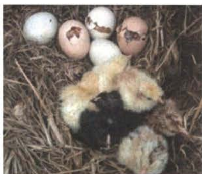
Nacimiento después de 21 días de incubación