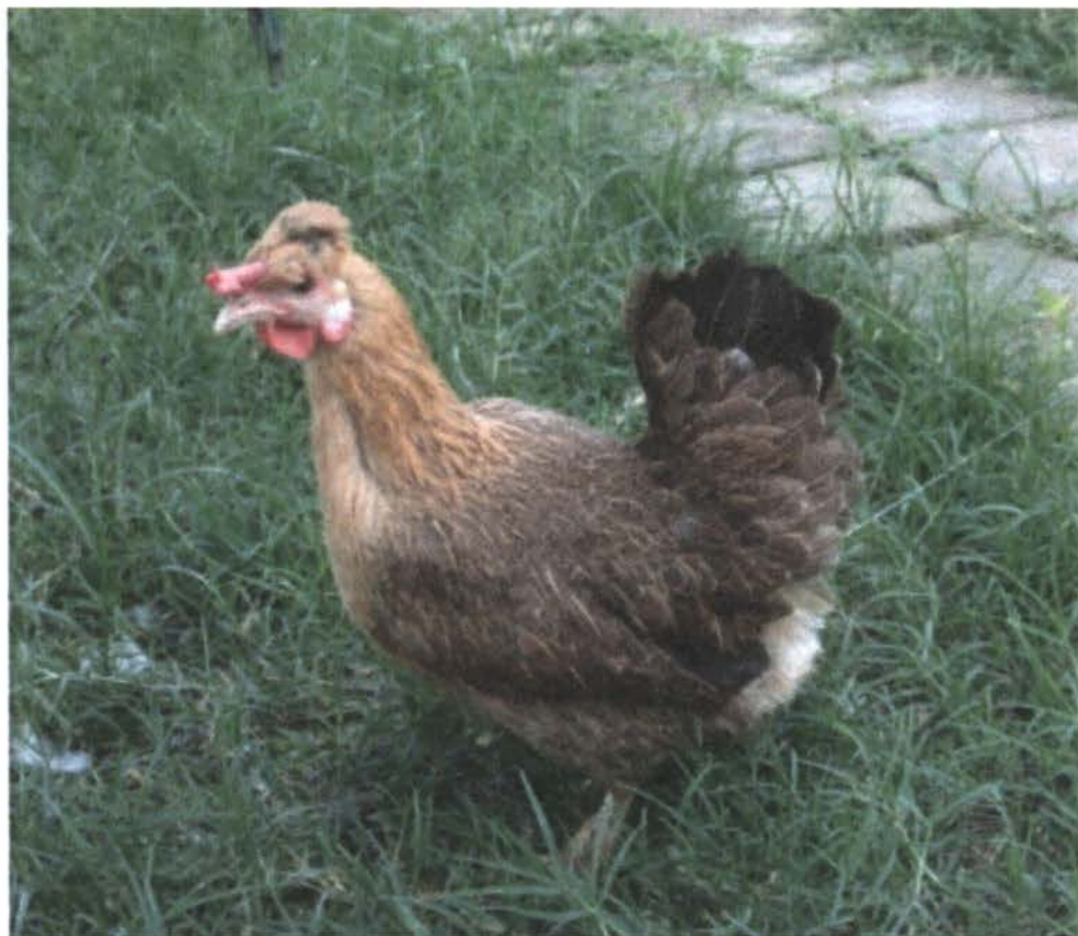
Figura 15: Gallus domesticus L. subespecie nanus variedad copetona