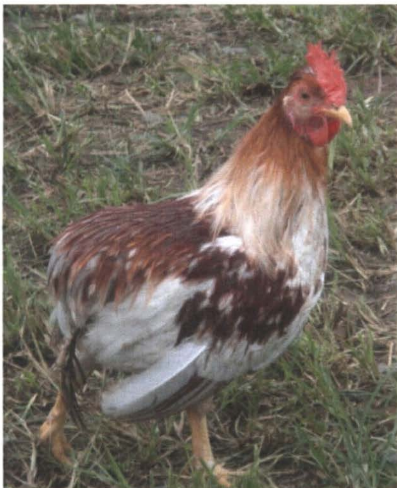
Figura 20: Gallus domesticus L. subespecie nanus variedad tapuncha