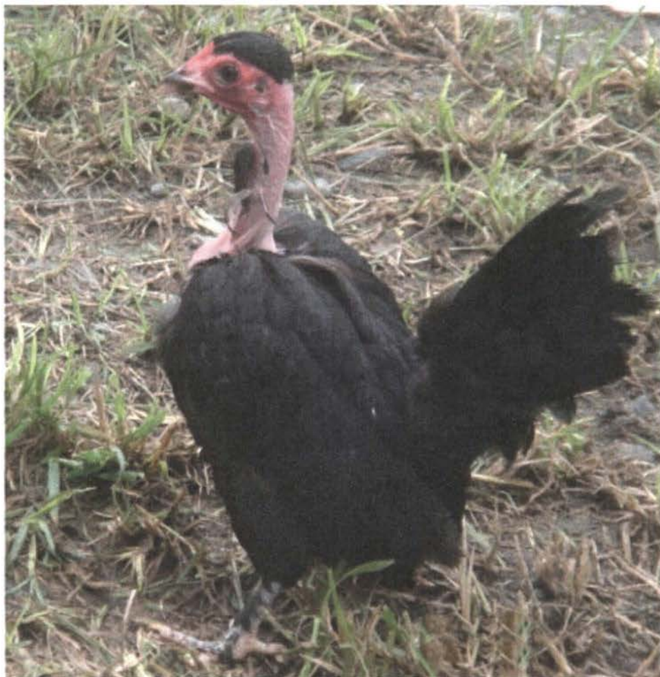
Figura 21: Gallus domesticus L. subespecie nanus variedad cuello desnudo