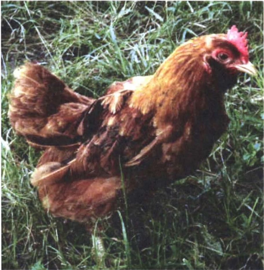
Figura 3: Gallus domesticus L. subespecie barbatus n.l. "tufus"