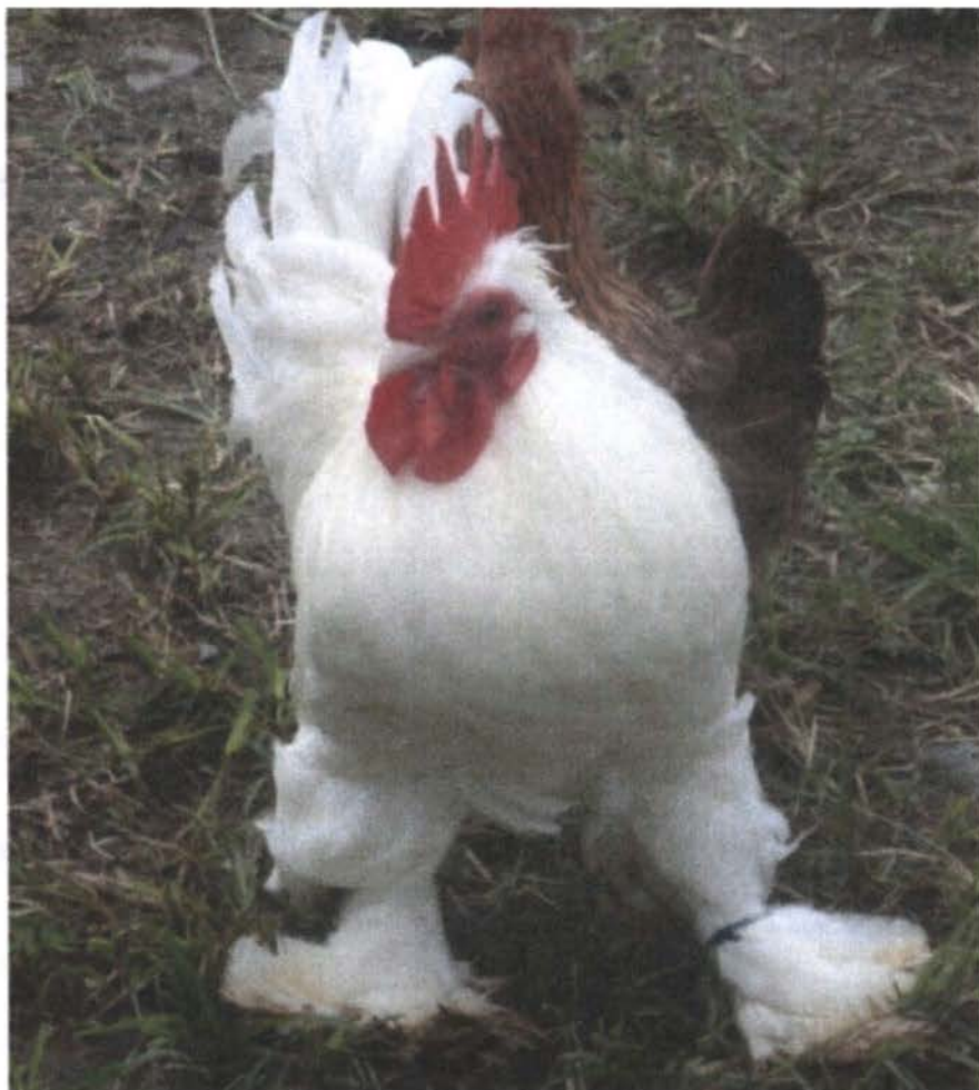
Figura 17: Gallus domesticus L. subespecie nanus variedad calzada