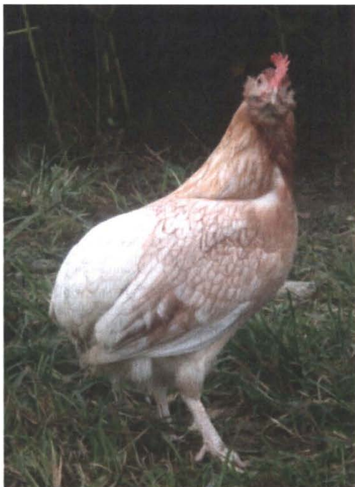
Figura 2: Gallus domesticus L. subespecie inauris n.l. "santandereana"