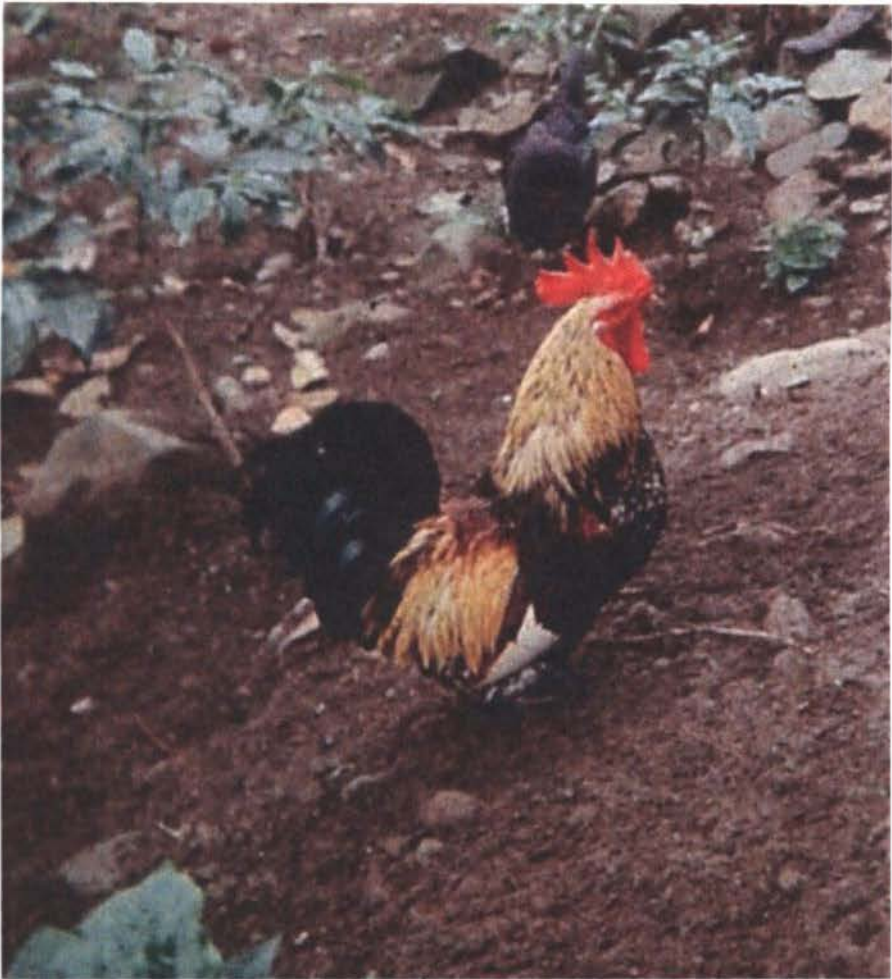
Figura 12: Gallus domesticus L. subespecie dorkingensis n.l. "enana", (Foto: Valencia Ll, N.F)