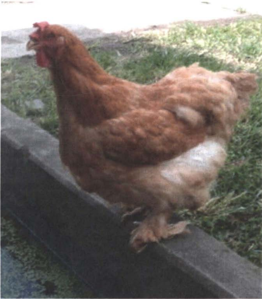
Figura 8: Gallus domesticus L. subespecie giganteus n.l. "zamarrona"