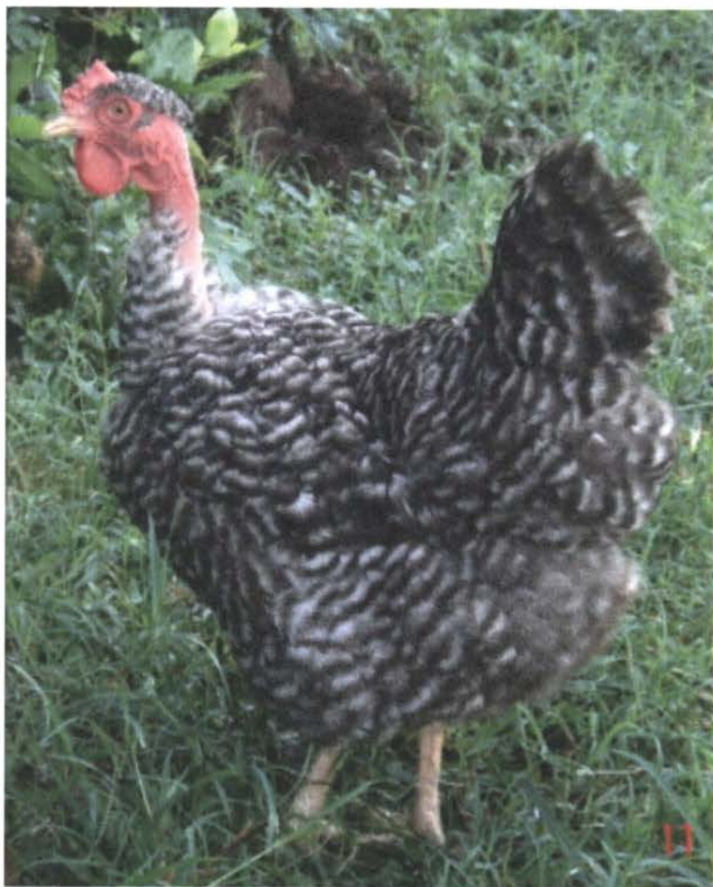
Figura 5: Gallus domesticus L. subespecie nudicollis n.l. "carioca"