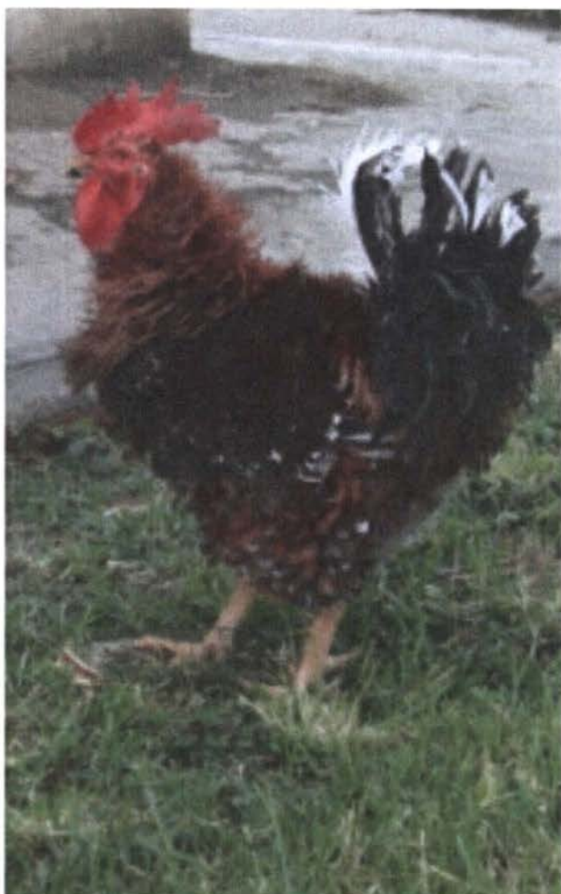
Figura 6: Gallus domesticus L. subespecie crispus n.l. "chusca"