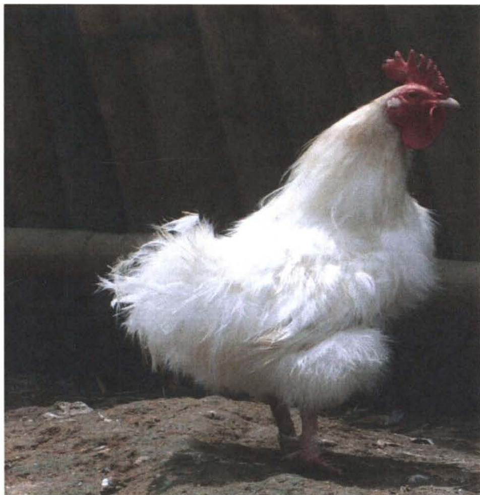
Figura 16: Gallus domesticus L. subespecie nanus variedad de pelo