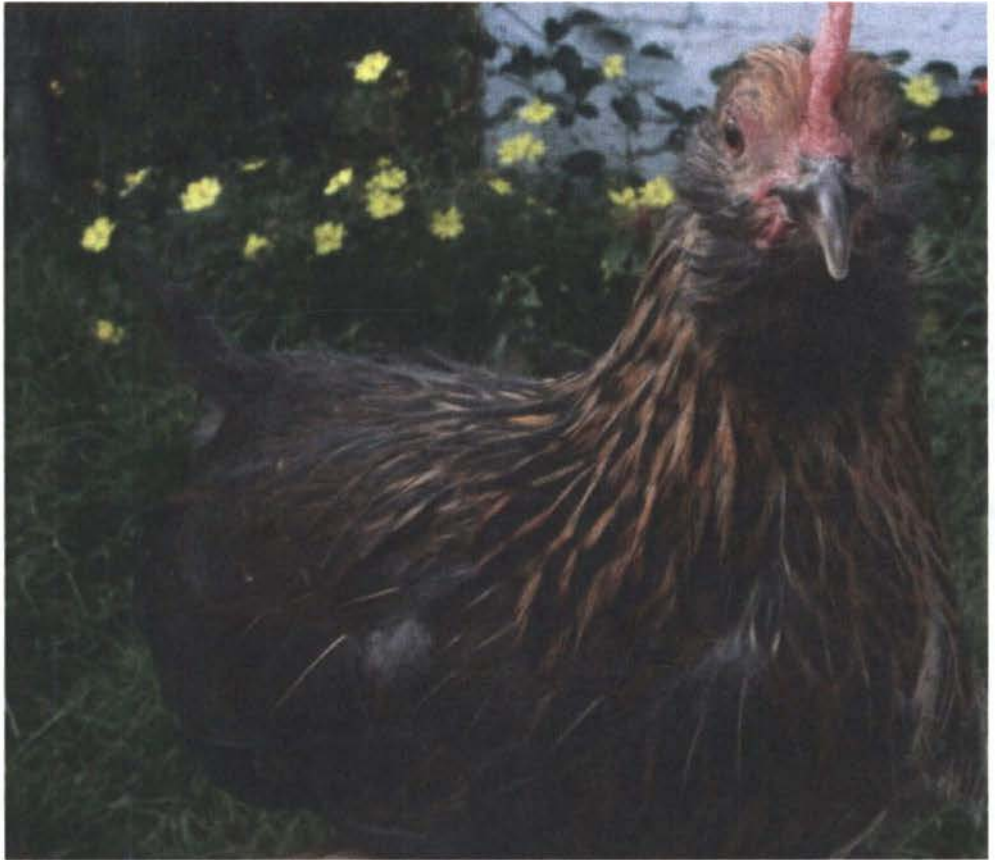
Figura 18: Gallus domesticus L. subespecie nanus variedad barbada