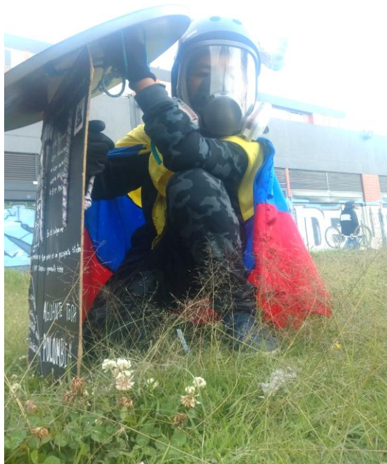
Fotografía tomada en Bosa Tintal – Bogotá Prado aledaño al portal de la resistencia Mayo de 2021

La ideología desempeña un papel crucial en la protesta juvenil. Cada sujeto discursivo trae consigo su propia subjetividad que está influenciada por variables de género, raza, clase social, orientación sexual, religión y otros aspectos de la identidad individual. Estas subjetividades se manifiestan en la protesta a través de diferentes formas de expresión, como discursos, manifestaciones artísticas, música y acciones directas. La diversidad de subjetividades enriquece el discurso y la lucha, ya que reflejan las múltiples perspectivas y experiencias dentro del movimiento juvenil. Entonces, en la teoría de Bajtín el dialogismo es una multiplicidad de voces dentro de un contexto discursivo en donde la interacción es constante, por lo que se enriquecen el lenguaje y la comunicación dando paso al significado.