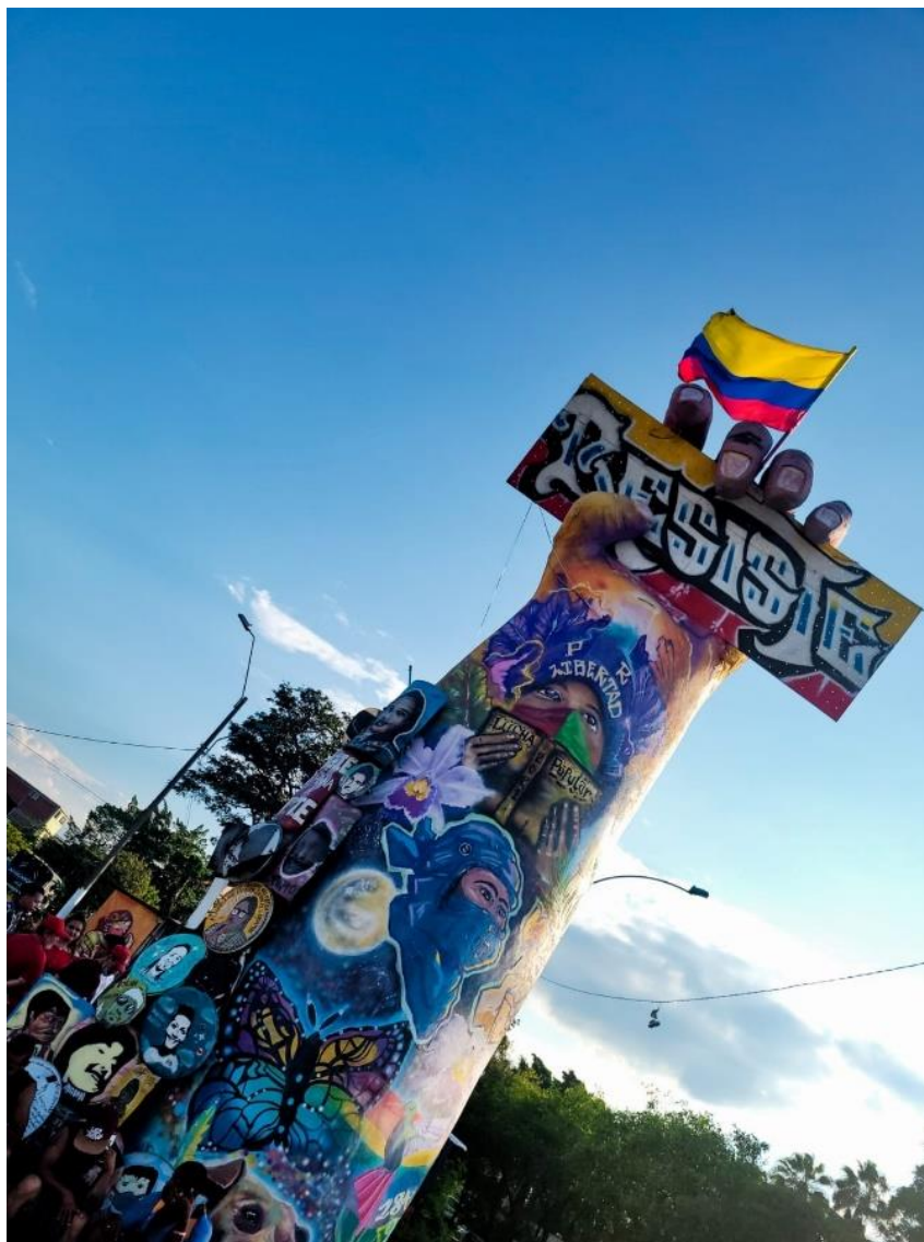
Monumento Puerto Resistencia

Construido durante el estallido social y representación de las luchas sociales.