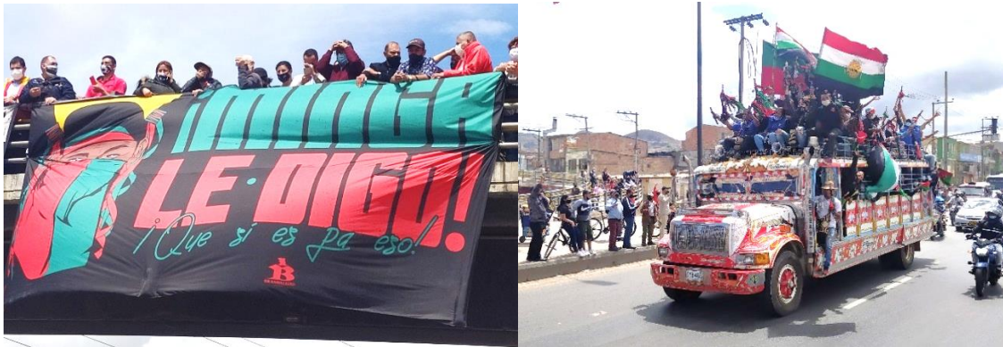
Fotos sujetas a derechos de autor Llegada de la Minga indígena a Bogotá por la autopista sur Soacha – Puente de la resistencia

La Minga, por su parte, representaba la lucha de los pueblos indígenas y campesinos por sus derechos y la defensa de sus territorios ancestrales, fue visible y de mucho aprendizaje la participación de la guardia indígena y la guardia cimarrona en la organización de marchas y otras actividades. Con sus tradiciones y saberes milenarios, se unieron a las protestas urbanas especialmente en Cali y Bogotá “Recuerdo que fue muy especial cuando la Minga nos acompañó en el portal de la resistencia” , se tejió un puente entre la ciudad y el campo, uniendo fuerzas en la búsqueda de un país más inclusivo y respetuoso de la diversidad cultural. El apoyo entre los diferentes grupos fue mutuo. La juventud encontró en la Primera Línea y la Minga una fuente de inspiración y resistencia, mientras que estos últimos vieron en los jóvenes aliados en la lucha.