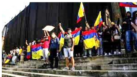
Imágenes sujetas a derechos de autor

La calle es el espacio propicio para la interacción social; salimos de los espacios privados para encontrarnos con otros, con los diferentes, lo que llamamos en ciencias sociales el encuentro con la alteridad, llegamos a la calle por ser el espacio fundamental para la comunicación social, “ espacio público ”, espacio que es de todos. Es allí donde convergen diferentes sujetos con sus voces, lenguajes e intereses, se entiende la calle como un espacio dinámico y múltiple donde las voces individuales y colectivas se entrecruzan y se manifiestan a través de la diversidad de la cultura. Para el 2021 las calles de Colombia llamaban a su encuentro, se trataba algo nunca visto, en expresión de los estudiantes el país vivía un momento de hostilidad “ Así como estaba la bandera, pues patas pa`riba, así estaba el país en esos momentos ”. Las calles gritando voces y se percibía el desorden y la intención del acto profundo.