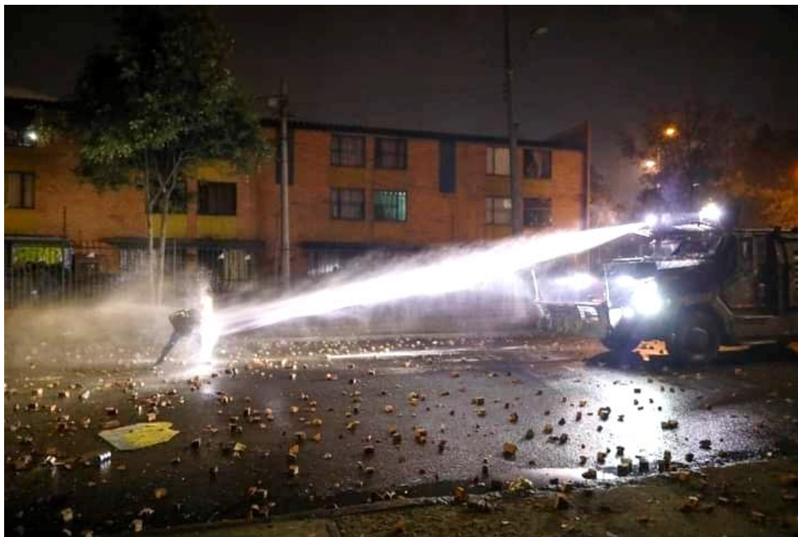
durante en Paro Nacional 2021.

Recibió el Premio Internacional Rey de España 2022.