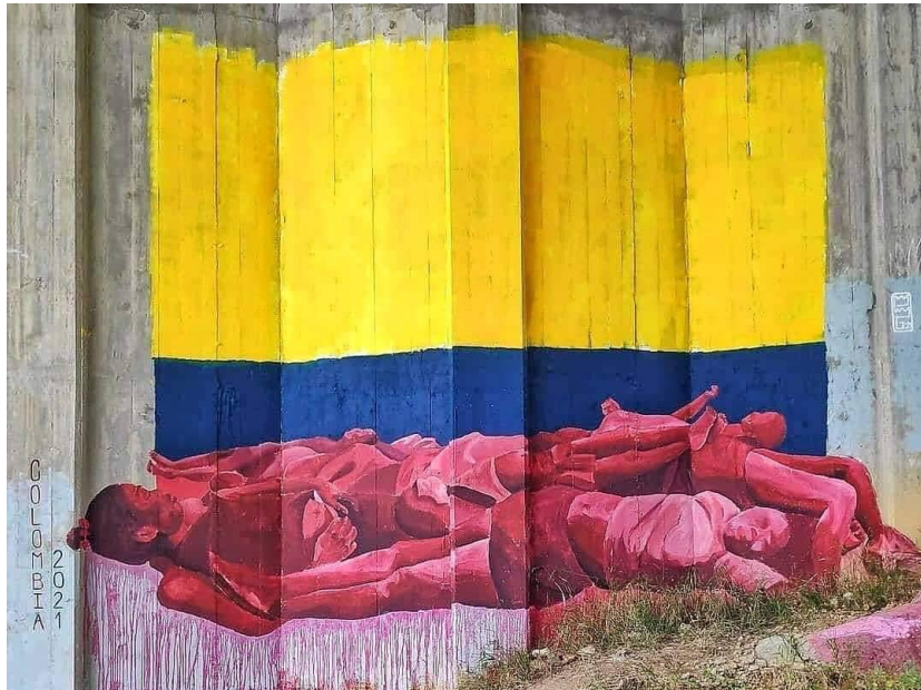
Fotografía sujeta a derechos de autor