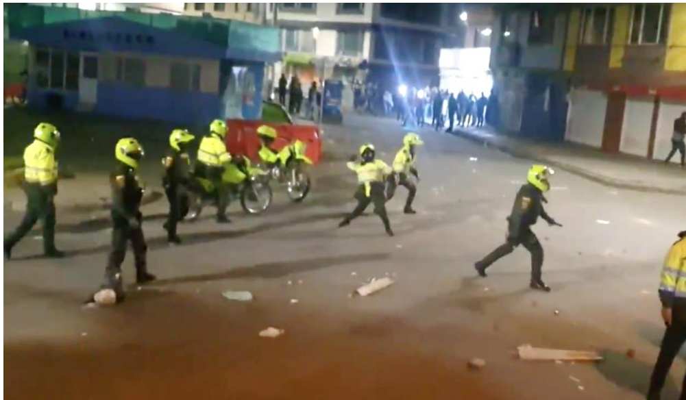
Fotografía tomada en Bosa Piamonte – Bogotá

“Yo vivo cerca del Cai y pues ahí se vivió mucha violencia y pues los policías pasaban tirando gases y pues también afectaban mucho a los de las casas cercanas”.