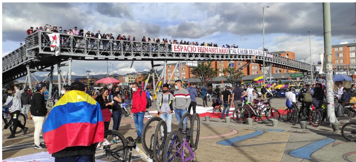
Fotografía tomada en Bosa Tintal – Bogotá Puente peatonal portal de la resistencia Mayo de 2021

Las redes sociales desempeñaron un papel esencial en la movilización y organización del estallido social. Los jóvenes utilizaron estas plataformas para difundir información, coordinar marchas y visibilizar las problemáticas sociales. Por otra parte, también se hizo evidente el impacto negativo de la desinformación y la polarización que se vivenció en las redes. Es imprescindible reflexionar sobre la necesidad de una ciudadanía digital responsable y consciente, es un tema que se ha ido aprendiendo con el paso del tiempo.