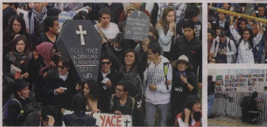
Miles de estudiantes se movilizaron ayer en el país y con pancartas rechazaron la reforma a la Ley 30.

En respuesta a las protestas, críticas y foros que ayer se cumplieron en todo el país por parte de estudiantes de universidades estatales, el Presidente Juan Manuel Santos reiteró que no entiende las protestas frente a la reforma a la educación cuyo objetivo primordial es mejorar su calidad. "Yo he dicho ayer qué protestan ahí no hay nada para protestar aquí. Tiene que ver con mejorar la calidad de la educación superior, pero también tenemos que hacer un gran esfuerzo en mejorar la calidad de la educación básica y la educación media, porque en términos generales toda la cadena de educación en Colombia está muy atrasada", expresó durante la presentación del Informe Nacional de Competitividad 2011-2012.