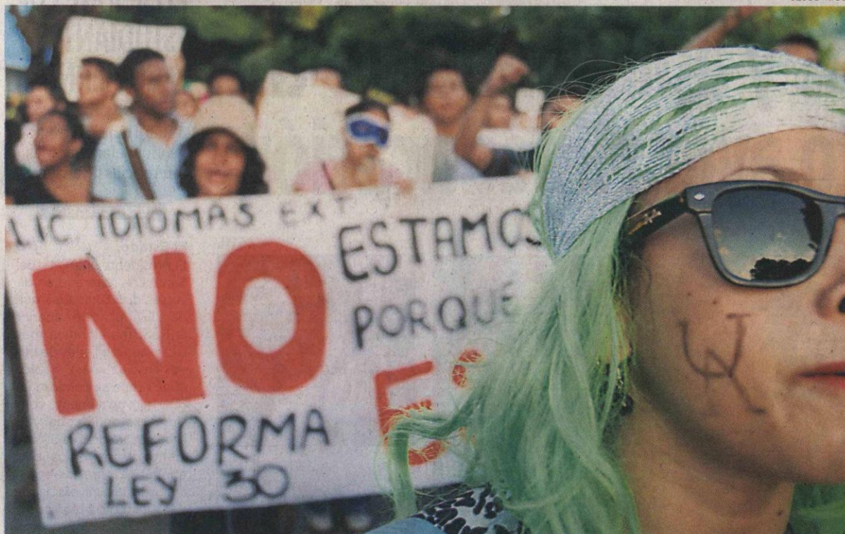
Un carnaval en defensa de la universidad pública organizaron los estudiantes de Uniatlántico ayer en Barranquilla.