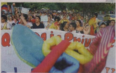
Los estudiantes exigen el retiro del proyecto de reforma a la Ley 30 del Congreso.

Con un carnaval en defensa de la educación pública los estudiantes de la Universidad del Atlántico salieron nuevamente a la calle a protestar por el proyecto de reforma a la Ley de Educación Superior (Ley 30) que sigue su trámite en el Congreso. Disfraces de marimondas, negritas pulpy y monocucos, entre otros, los estudiantes mostraron que de manera creativa pero a la vez contundente siguen en defensa de la educación pública y para ello portaron mensajes abusivos a la reforma de la Ley 30 y su rechazo. La marcha que salió a las 4 de la tarde del bulevar de la 8 con calle 30, finalizó en el parque del Estadio Metropolitano y allí en medio de faros y antorchas los estudiantes ratificaron que se mantienen en paro indefinido hasta que se modifique el proyecto teniendo en cuenta sus planteamientos e su hunda. El cese indefinido se adelantó el pasado 11 de octubre