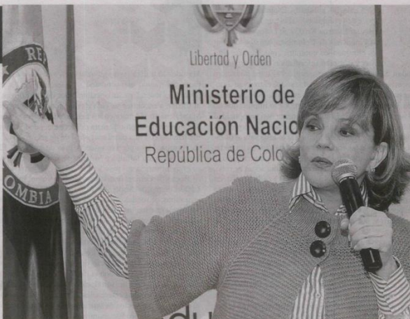
La ministra de Educación María Fernanda Campo destacó los alcances del proyecto.

Pública ción de recursos propios que consigue en el ejercicio de sus recursos de formación, extensión e investigación de los cuales alcanzaron en 2009 1.100 millones de pesos. Los recursos de inversión de Colciencias para proyectos de investigación de ciencia y tecnología en 2011 a 300.000 millones de pesos. proyectos de fomento dirigidos por el Ministerio de Educación Nacional son de 1.100 millones de pesos en 2011. En 2010, el Sena a formación tecnológica, y educación para el desarrollo humano. En 2010, se destinaron 1.77 millones de pesos para la infraestructura física y tecnológica del Ministerio de Educa-