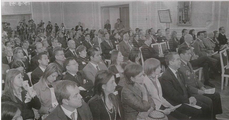
En todos sectores del país en distintos escenarios.