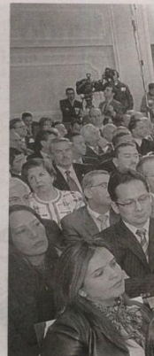
La reforma universitaria fue debatida