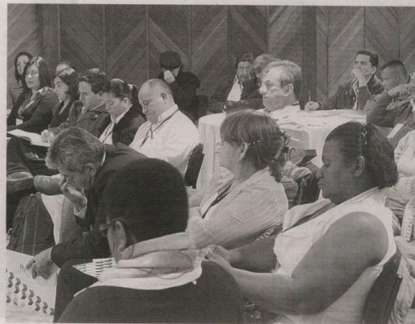
La reforma universitaria fue examinada con el sector académico en varios foros nacionales.

Con el fin de p regional, este aspecto criterios para la distri adicionales para las l crearán una instancia departamental a travé parlamentares de Ed los cuales contarán ec