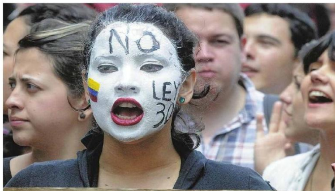
Marchas. Una propuesta de los estudiantes es que el Gobierno participe mucho más con apoyo económico para hacer que los costos de las matrículas no sean tan altos y así poder fomentar más la educación superior.

Docentes universitarios, rectores y expertos analizan las necesidades de la educación superior.