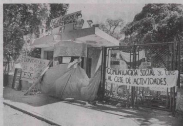
LA UNIVERSIDAD FRANCISCO DE PAULA SANTANDER permanece bloqueada por los estudiantes como consecuencia del paro nacional.