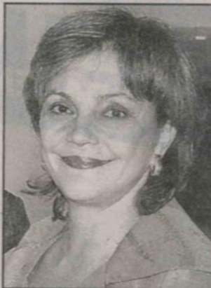
MAR A FERNANDA CAMPO , ministra de Educaci n Nacional

En el proyecto qued  establecido que el sector de la educaci n superior recibir  a n m s recursos que provendr n del Sistema General de Regal as.