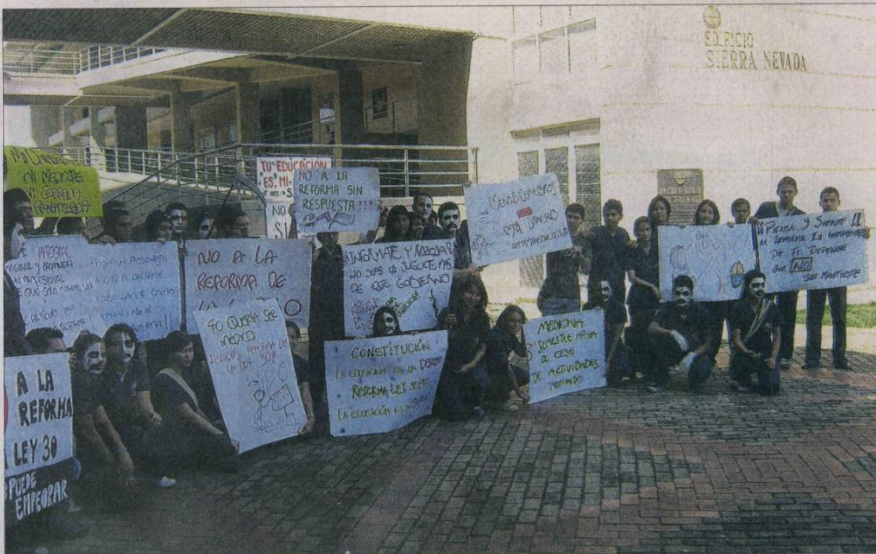
LOS ESTUDIANTES de las diferentes facultades de la Universidad del Magdalena adelantan esta jornada de protesta pacífica en la Plaza de la Catedral Basílica de Santa Marta y el Centro Histórico.

las infraestructuras y a los estudiantes en las aulas.