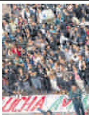
Estudiantes siguen a la espera.