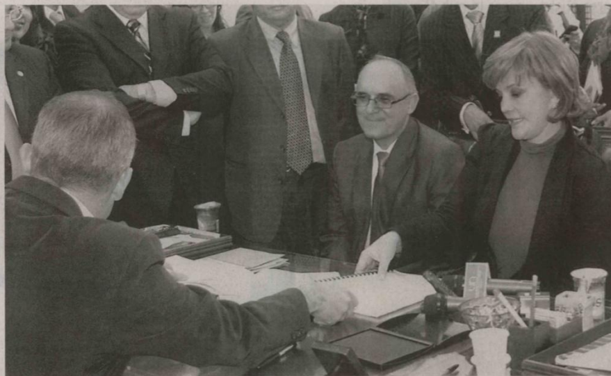
La Ministra de Educación, María Fernanda Campo Saavedra, radicó ante la Secretaría General de la Cámara el Proyecto de Reforma a la Educación Superior. Estuvo acompañada por el Viceministro de Educación Superior, Javier Botero Álvarez. El articulado final está en www.mineducacion.gov.co .

Fue de esos encuentros de donde salieron modificaciones a la propuesta inicial que -también por recomendación de la coalición de Gobierno, Mesa de Unidad Nacional- sufrió la modificación más importante cuando Santos Calderón anunció que se retiraba el componente que permitía el sistema la existencia de universidades con ánimo de lucro.