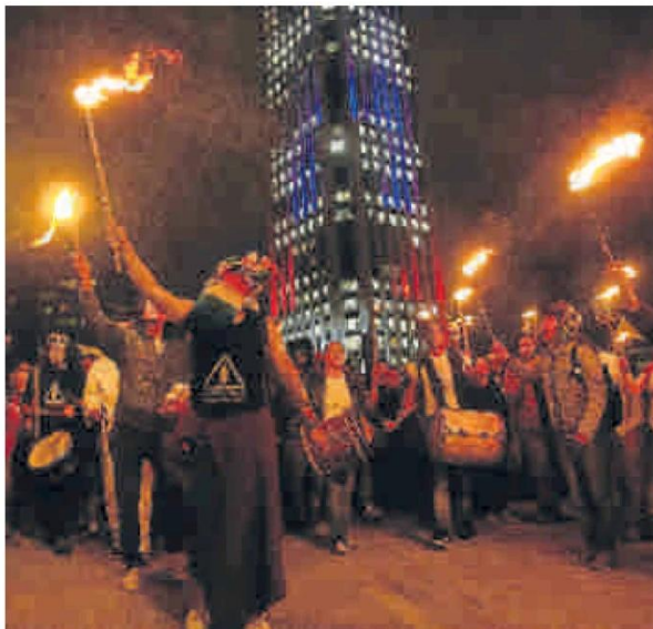
Marcha convocó a miles de universitarios que sentaron su voz de protesta por la ley.

A las 8:30 de la noche, los marchantes se besaron