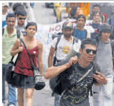
Estudiantes de Manizales vienen caminando a Bogotá. JAVIER NIETO