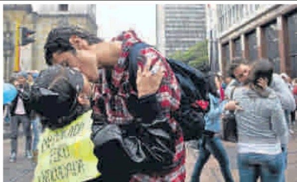
Al mediodía, unos 500 estudiantes participaron en una 'besatón' en el centro.