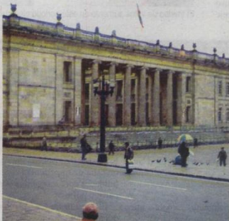
El proyecto tiene casi asegurado su paso en el Congreso.

La reforma contempla la creación de un fondo de manutención para los jóvenes de menores recursos económicos, para Sisben 1 y 2, de $630 mil semestrales. Con esta reforma lo que buscamos es mejorar la calidad, ampliar la cobertura, incorporar innovación, ciencia, tecnología y desarrollo científico en nuestro sistema educativo.