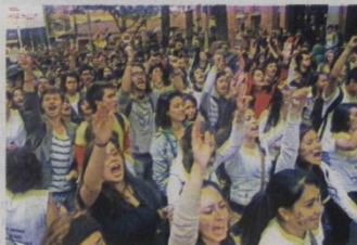
Según la ministra de Educación, la reforma no busca la privatización. Sin embargo, los estudiantes afirman lo contrario.

Además la reforma prevé que lleguen recursos de regalías. Un billón de pesos anualmente irán para ciencia, innovación y tecnología. Nuestras universidades y centros de investigación tendrán una oportunidad maravillosa para presentar proyectos y poder gestionar recursos. No entiendo por qué se dice que se quiere privatizar y perjudicar la educación superior.