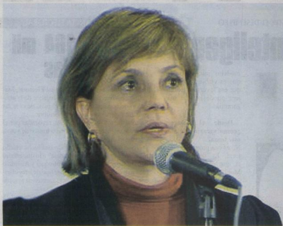
La ministra de Educación Nacional, María Fernanda Campo Saavedra.

La Ministra de Educación, María Fernanda Campo, admite que hay desinformación y falta de información por parte de docentes y estudiantes sobre la reforma educativa presentada a consideración del Congreso, lo que explicaría las huelgas y movimientos anunciados para las siguientes semanas.