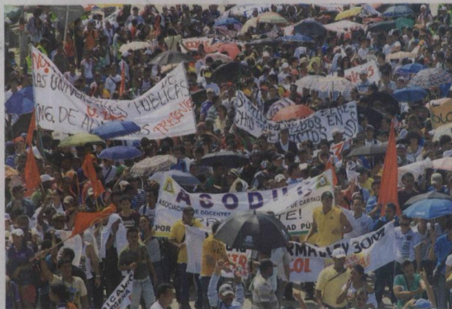
■ A la manifestación masiva de ayer asistieron tanto miembros de universidades como de colegios públicos de la ciudad.

Entre estos puntos que mencionan los estudiantes está la privatización de las universidades públicas ante la posibilidad de que organizaciones privadas invirtieran en ellas; también el porcentaje al que ascenderían los recursos destinados a los centros estatales de formación, pues según los manifestantes resulta insuficiente, entre otros.