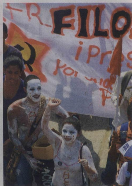
■ Los manifestantes sostienen que los recursos para las instituciones públicas deben incrementarse, pues “sin presupuesto no se puede hablar de calidad en la educación”, dijeron.

Martínez Barrios advirtió que toda esta información se encuentra en la página del Ministerio de Educación www.mineduccion.gov.co y reafirmó que “el Gobierno ha cumplido y no ha ratificado nada aún”.