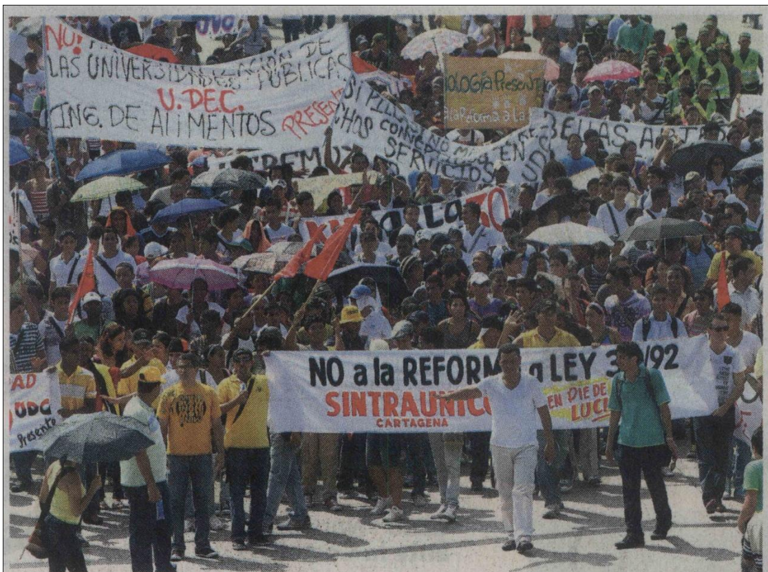
AROUND MESTRE - EL UNIVERSAL